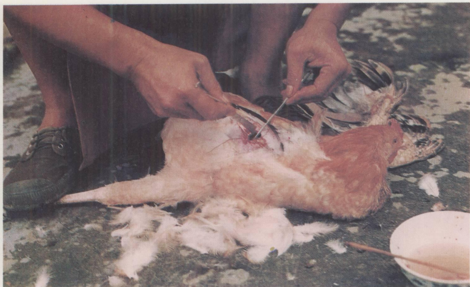
↑ 阉割小公鸡。 Castrating cockerel.