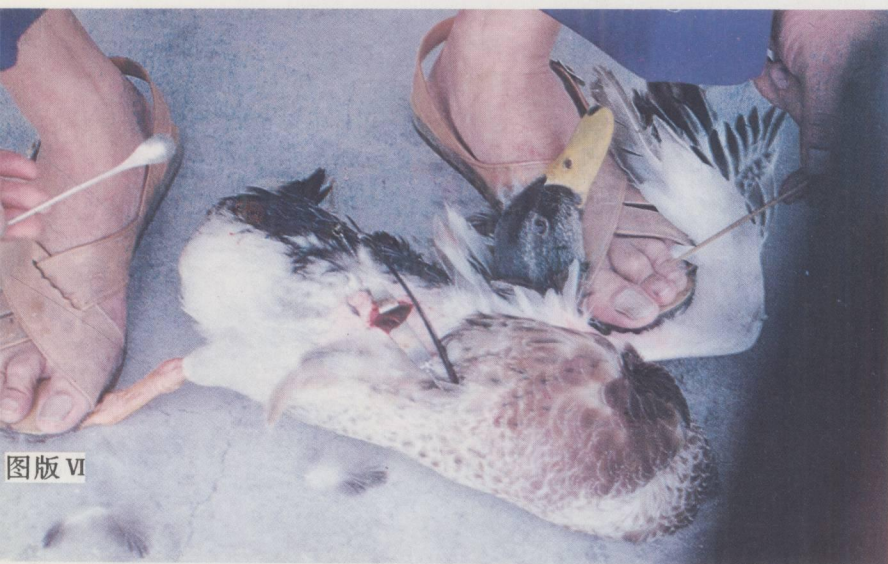
↓ 阉割小公鸭。 Castrating duckling.