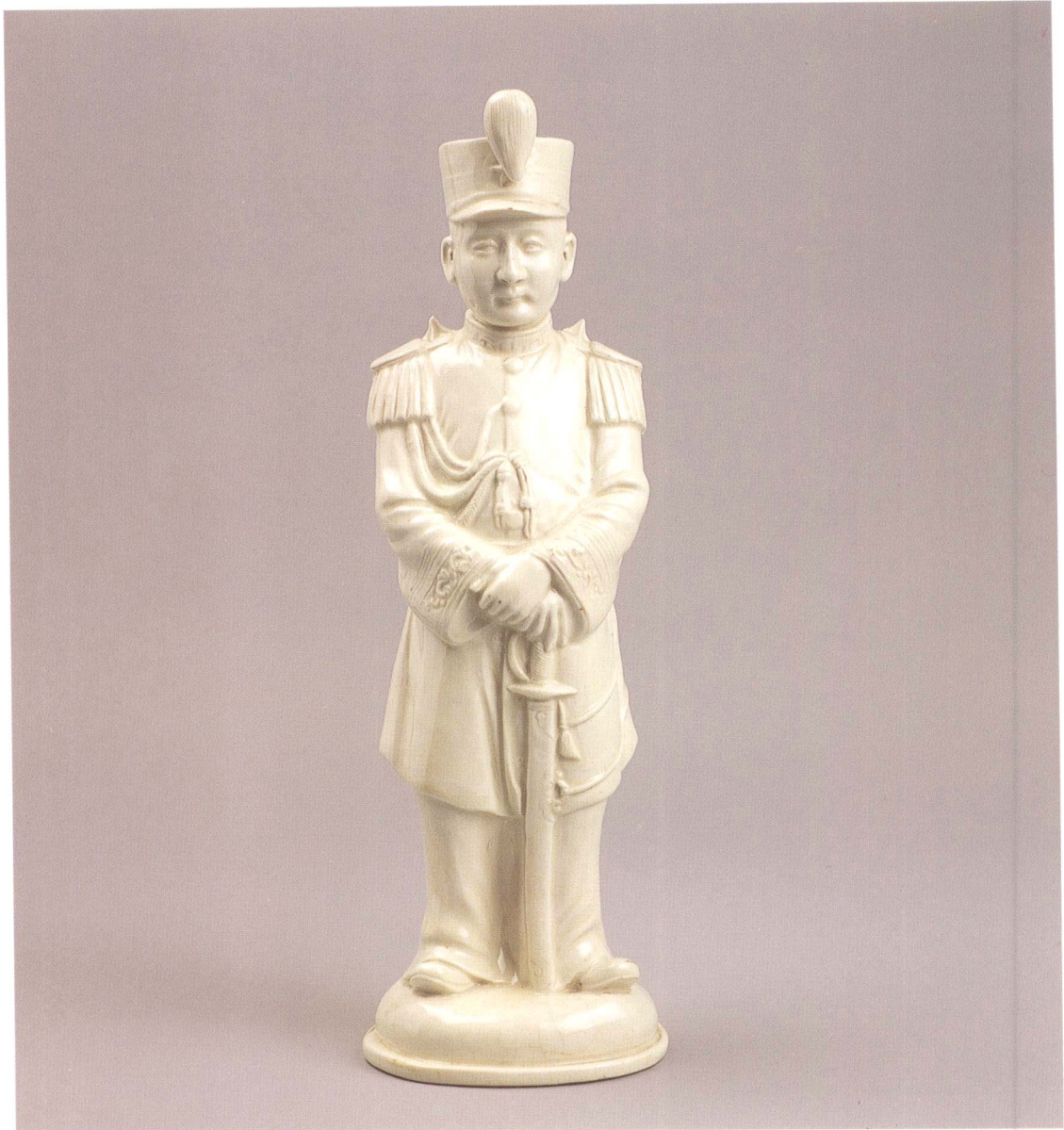
中山先生像 素白 廣東省 民初 高28.5cm 寬9.5cm 登錄號 0156