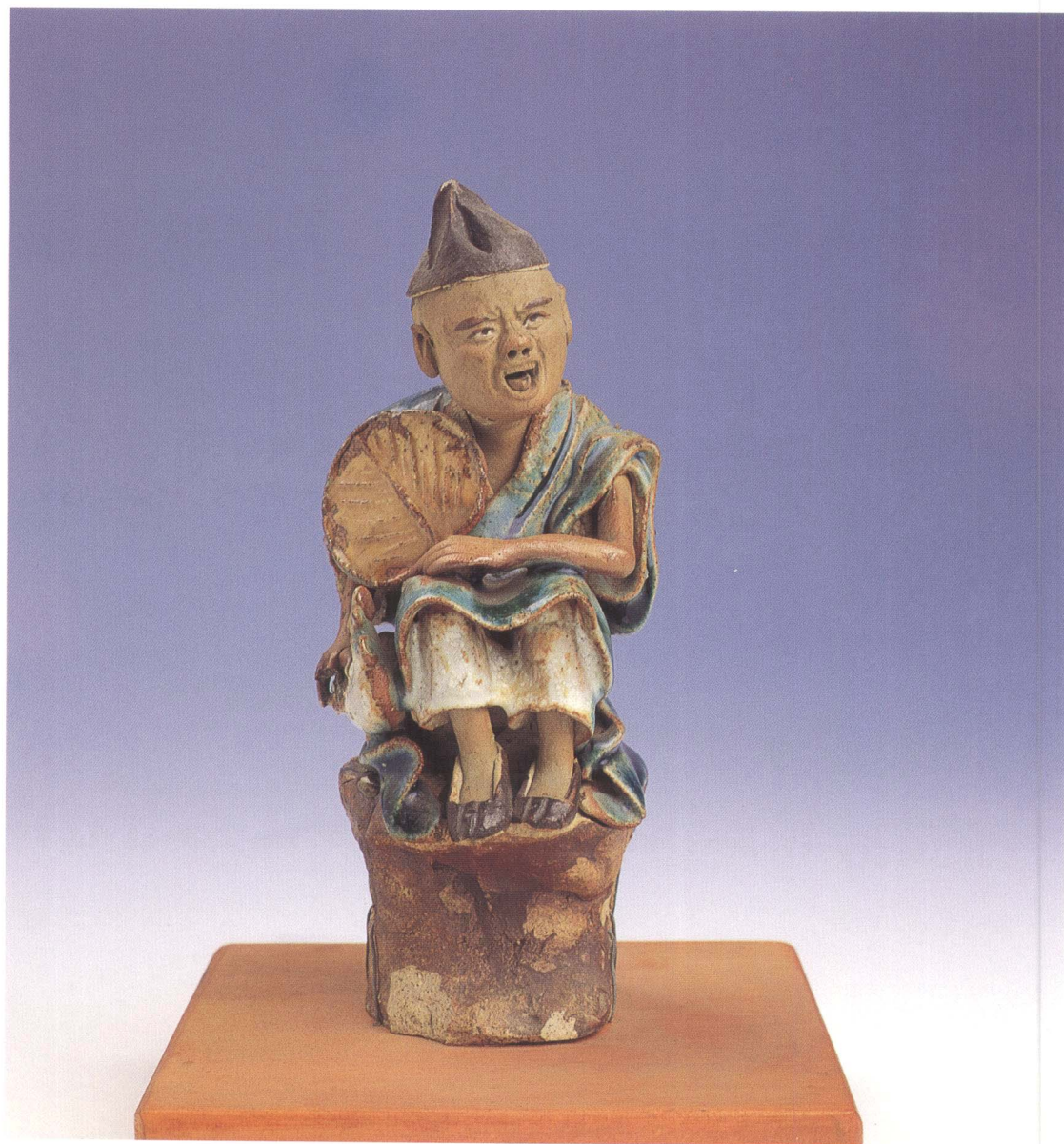
時遷偷雞像 彩釉 廣東省 民初 高15cm 寬6cm 登錄號 0161