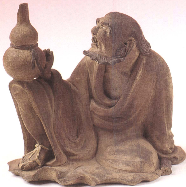
李鐵拐像 扶葫側坐 素 廣東省 民初 高12cm 寬12.5cm 登錄號 0163