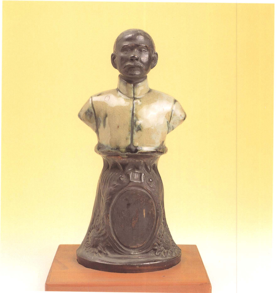
中山先生像 彩釉 廣東省 民初 高28cm 寬13cm 登錄號 0155