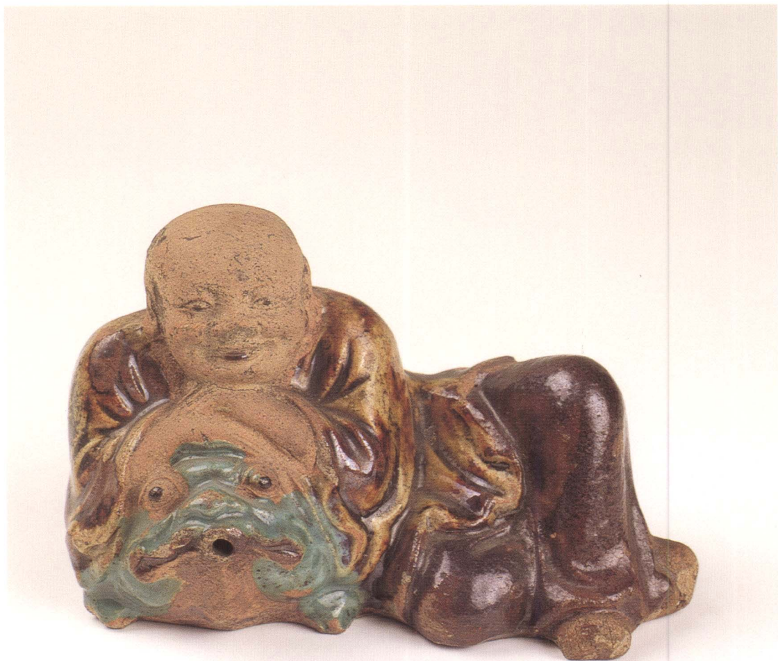
劉海蟾蜍像 彩釉 廣東省 民初 高6.5cm 寬10.5cm 登錄號 0162