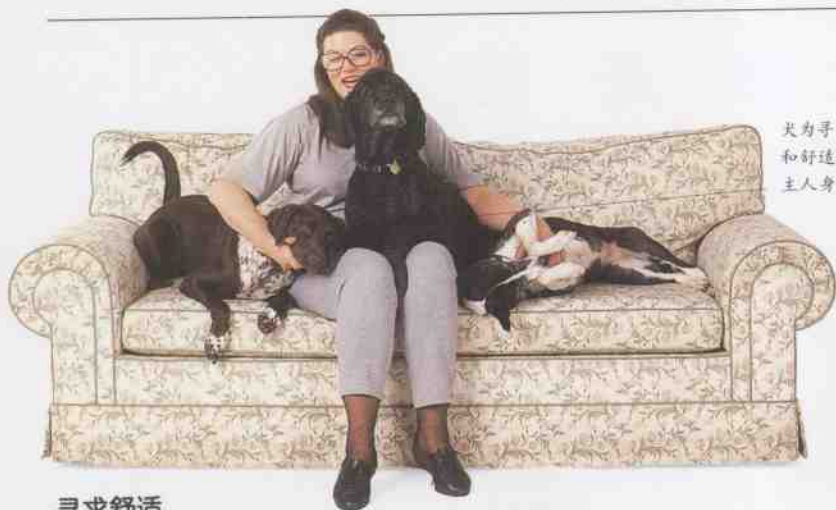
犬为寻求安全和舒适，靠在主人身上