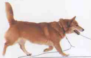
犬受玩具诱惑奔向主人