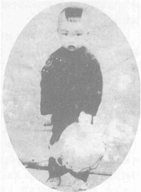
儿时 in 四川巫山县城(1911年)

据说,王朝闻父亲在世时,对李四姐也很好。当年李四姐不过十来岁,父母坐轿子回娘家,她抱着包袱跟在后面,有时候还要小跑。父亲便叫她把包袱放到轿子里来,减轻一点负担。母亲脾气躁,为了一点小事就呵斥她,父亲总是从旁劝解,说她也是人,不过因为家里穷才卖到你家,我们不要苛待她。在父亲的教