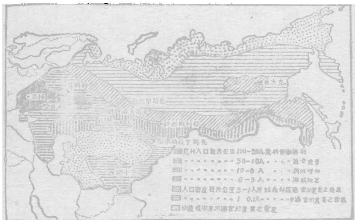
蘇聯各區土地利用比較圖