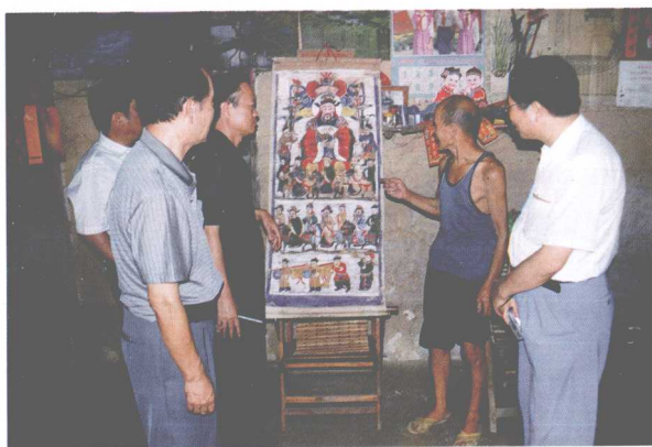
考察组在兴 宾区合隆村考察