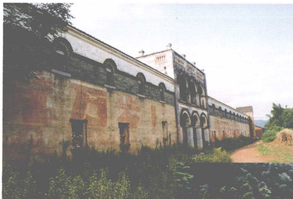
武宣县二塘黄肇熙庄园