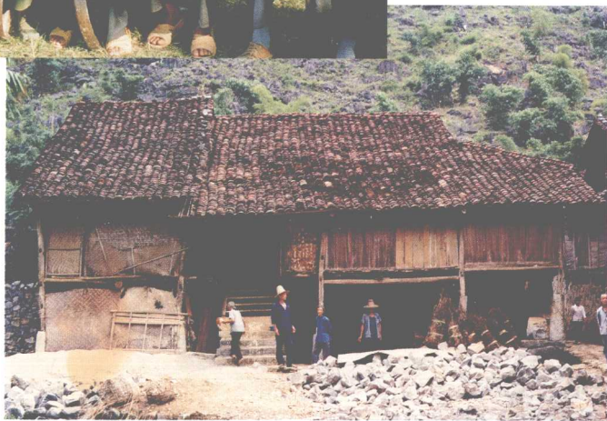
忻城县北更 乡中团村传统民 居——干栏