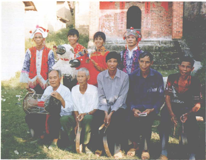
武宣县桐 岭镇师公队