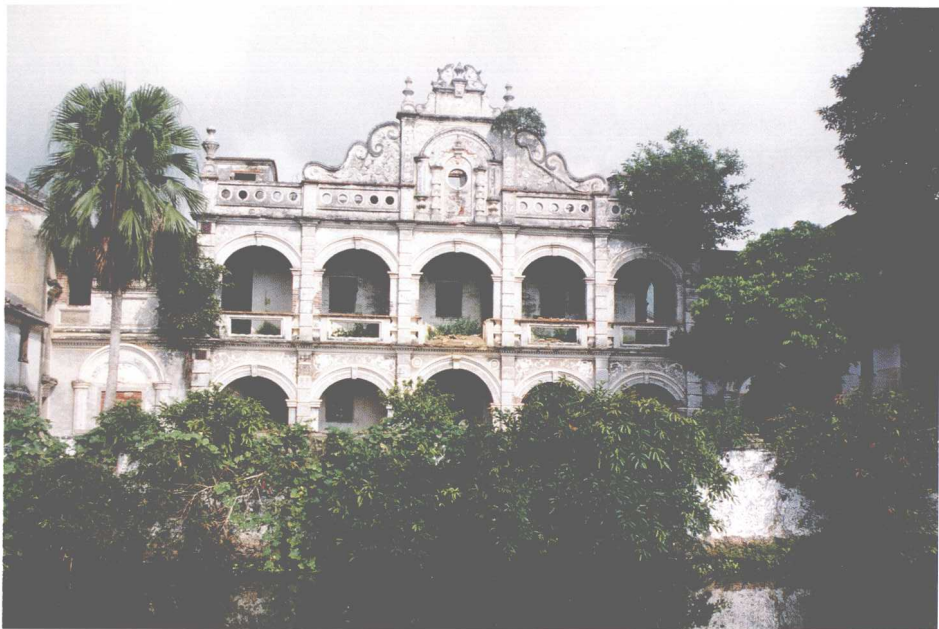
武宣县桐岭镇郭松年公馆