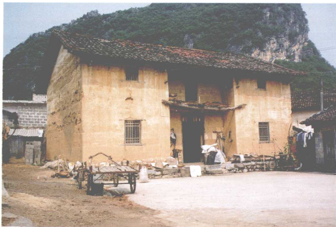
兴宾区壮族 传统民居建筑