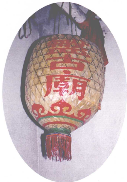
武宣县桐岭镇大祥村盘古庙中的灯笼