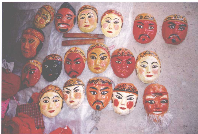
象州县架村师公面具