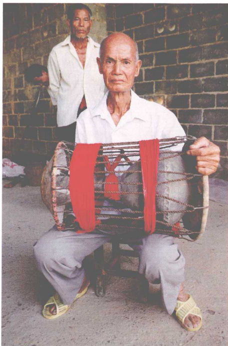
象州县架村老艺人拍击陶腰鼓