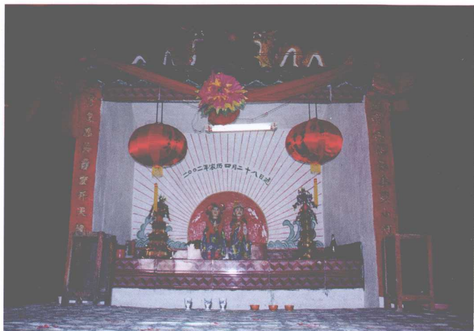
兴宾区甘 东村盘古殿坛