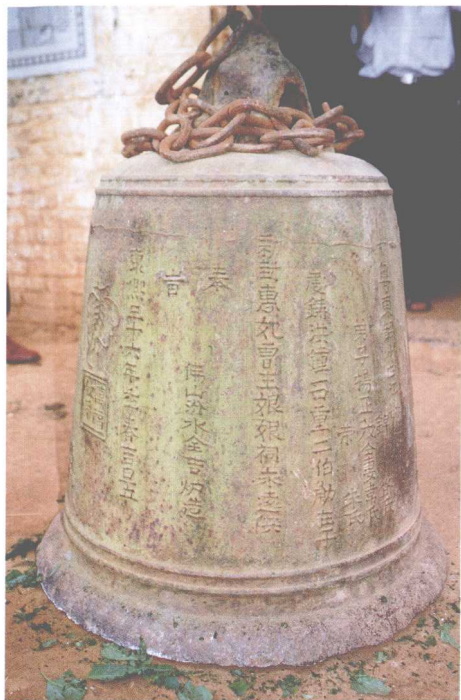
武宣县盘古庙中的铁钟