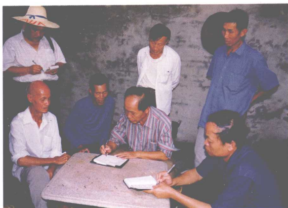
考察组访问象州 县架村老师公