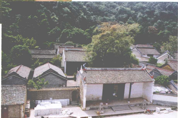
忻城县莫氏土司衙署