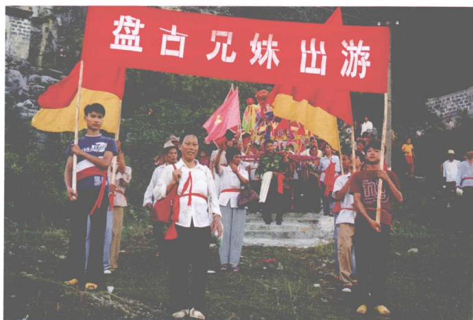
兴宾区甘东 村在盘古诞日抬 盘古兄妹出游祝 祷活动