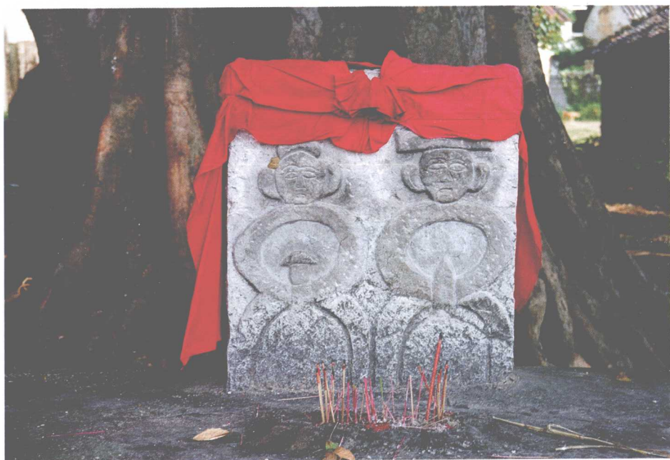
武宣县桐岭镇雅岗村的社王石刻像