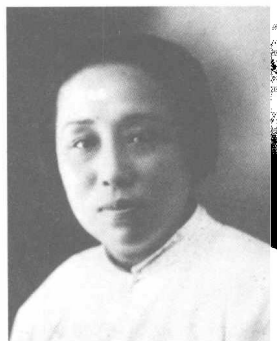
何香凝 (1878-1972), 广东南海人。