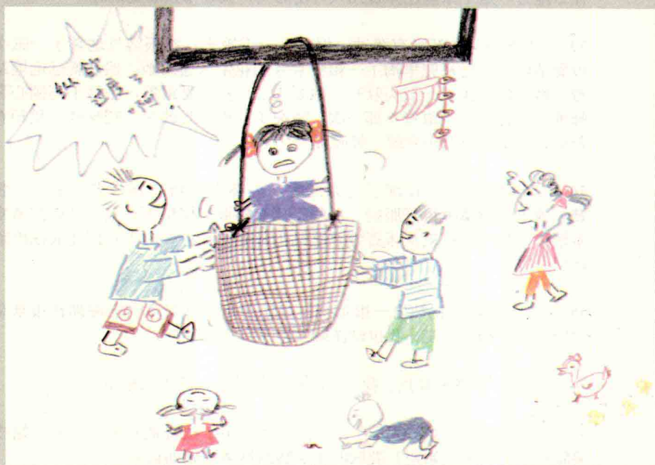
19. 我们在打秋鞦。就是从梁上套根麻绳再绑上个箩筐，一个人坐在里面，另外的人推，但是箩筐只是打转不会前后摆，我坐在里面脑壳昏得想发吐，大喊：不要转了啊！纵欲过度了啊！