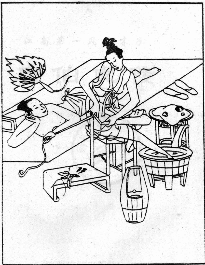
西人研究缠足专书《金莲》的封面，参看本书第102页。