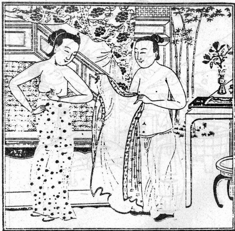
明万历四十三年刊印的套色版画《风流艳畅图》，参见本书第98页