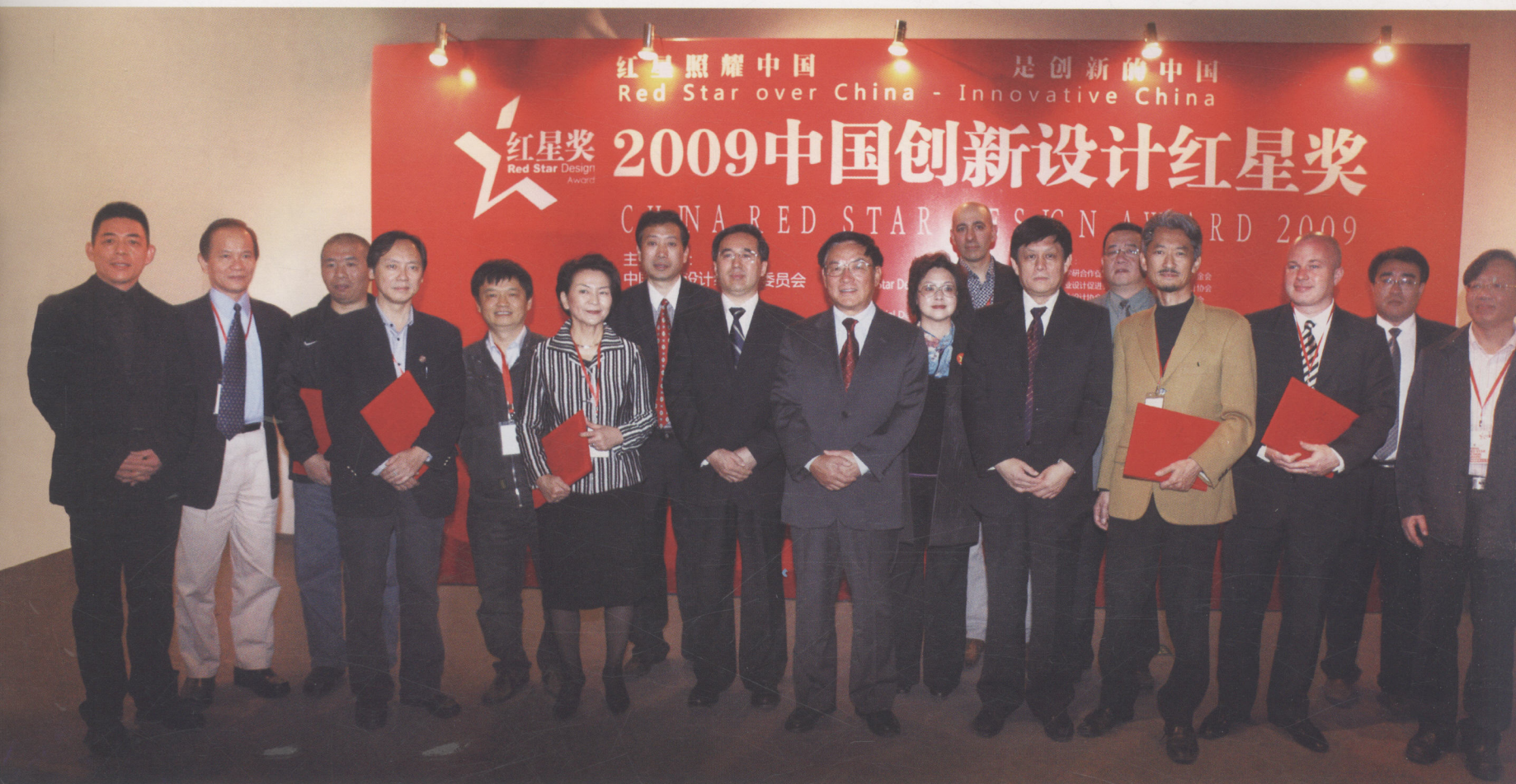
2009中国创新设计红星奖评委合影 Group photo of jury of 2009 China Red Star Design Award