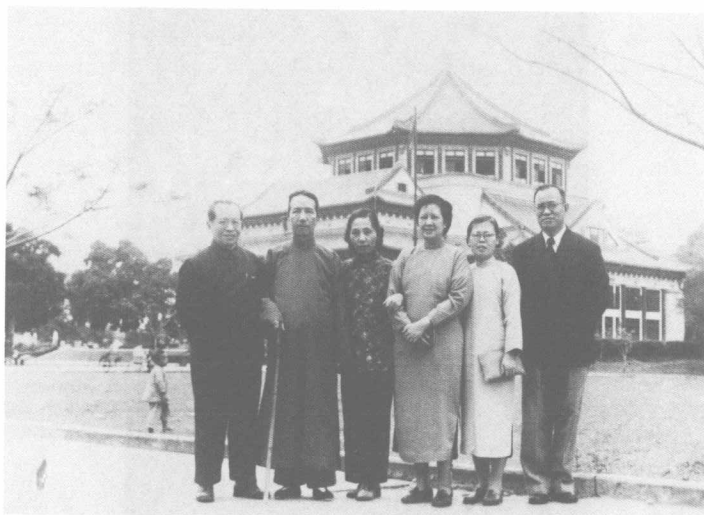
陳寅恪、唐質與陳序經、姜立夫 婦於廣州中山紀念堂前留影