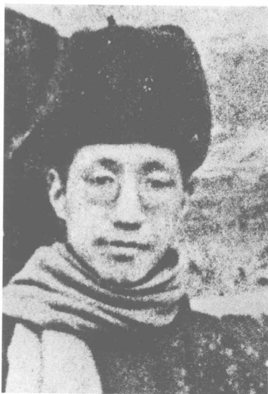
抗日戰爭前攝於北平北海