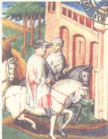
波罗兄弟抵达不花刺城 (1264)