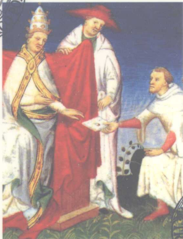
波罗兄弟将忽必烈的信转交给教皇 (1271)