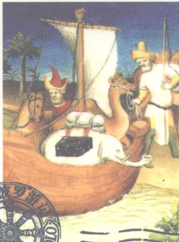
马可·波罗在海南海岸 (1292)