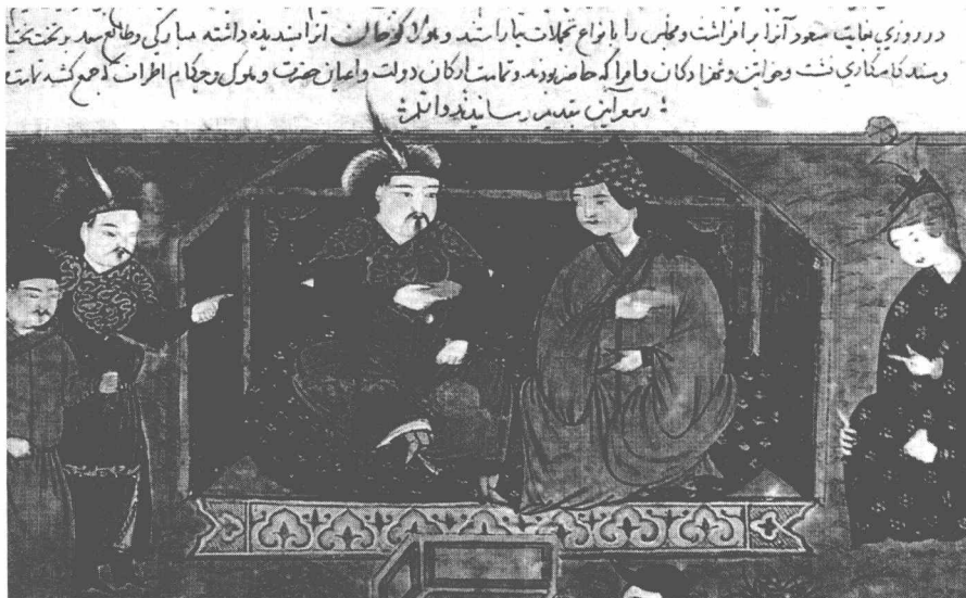
旭烈兀与他的妻子脱古思可敦

他们从不里阿耳首途，行抵一城，名称兀迦克(Oukak)，是为别儿哥所领国土之尽境。他们渡伏尔加大河，经行沙漠十有七日，沿途不见城市村庄，仅见鞑靼人的畜皮帐幕同牧于田野之牲畜。