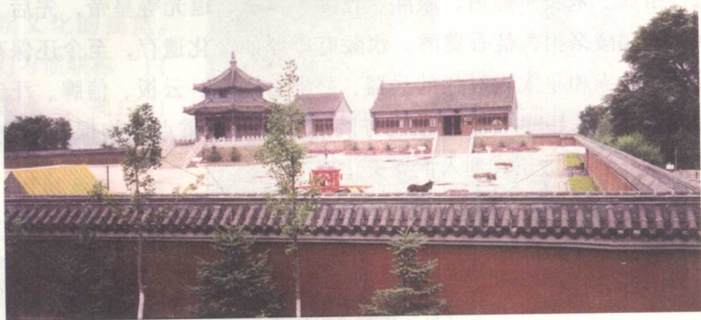
汗宫大衙门

赫图阿拉城有“清朝第一都城”之称，位于辽宁省新宾满族自治县永陵镇东一处低矮而又平坦的山冈上，后依绵绵烟囪山，前临涓涓苏子河。明朝初年，建州女真的一部分迁移到这里，后来这里成为努尔哈赤祖父觉昌安的军寨。1559年，努尔哈赤就诞生在这里。1603年，努尔哈赤在这里建内城，1605年又建外城。全城方圆十华里，居住十万多人。内城住王公贵族，建有汗宫大衙门、八旗衙门、驸马府、关帝庙、地藏寺、显佑宫、启运书院等。外城屯驻军队，住居百姓。努尔哈赤就在外城囤积粮草，制造武器，演练兵