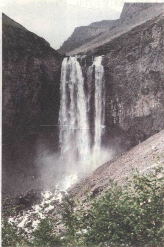
长白山瀑布

与长白山地位相对应的是黑龙江，黑龙江古称黑水，两岸土地肥沃，是满族先世崛起的大本营，也是满族文化的摇篮。人们习惯联称“白山黑水”，视白山黑水是满族的故乡。对黑龙江，满族民间有祭祀龙王、水神的活动。