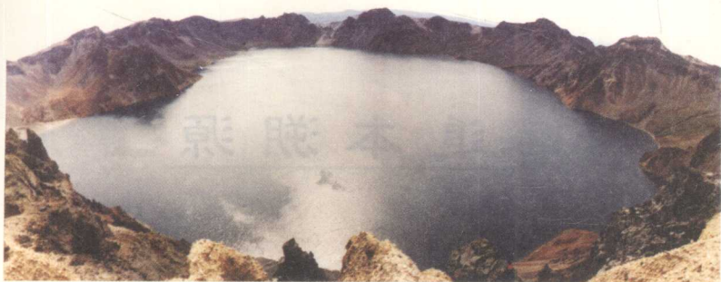
长白山天池