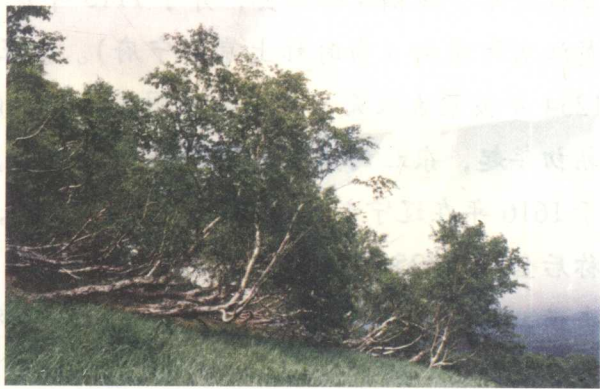
匍匐在地而后奋然崛起的长白山岳桦林——长白山的独特景观

长白山是辽宁、吉林、黑龙江三省东部和中朝边境东北部山地的总称，东北——西南走向。长白山主峰白头山的山顶，有一个高山湖泊，就是著名的火山口湖——天池。天池海拔 2155 米，面积 9.2 平方公里，平均水深 200 多米，最深处 313 米，是松花江、鸭绿江、图们江的源头。传说，天宫里有三个美丽的仙姝格格，她们是姐妹三人，其中三仙女佛库伦尤为美貌聪明，光彩照人。一天，她们看到银装素裹的长白山上，16 座山峰环抱一湖碧水，峰峦倒影与蓝天白云的倒影在湖面上随波荡漾，