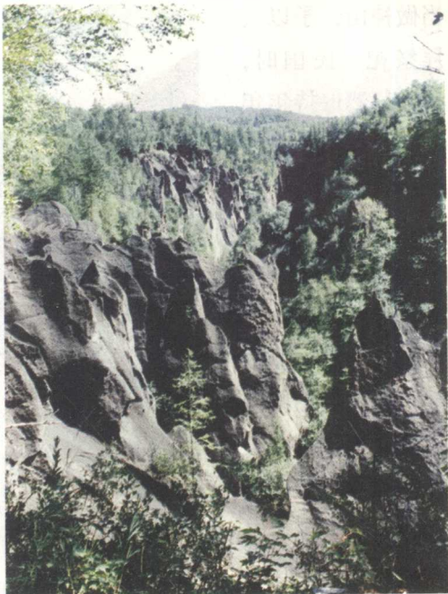
长白山南麓的锦江大峡谷

美不胜收。她们被长白山的美丽与圣洁深深打动了，于是乘彩云来到长白山，在湖水中尽情游泳嬉戏。这时从天边飞来一只神鹊，口中衔着一枚红果，放到佛库伦的衣服上。佛库伦见它红艳可爱，便含进口中吃了，于是便有了身孕，后来生下一个男孩。佛库伦给孩子取名布库里雍顺，希望他长大后像附近的布库里雍顺山峰一样高大雄伟。