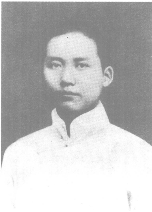
毛泽东（一九一九年）