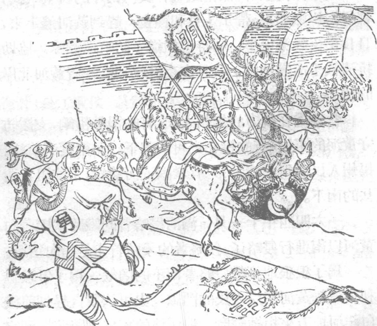
抗清軍民打敗了進攻宿遷的清兵。