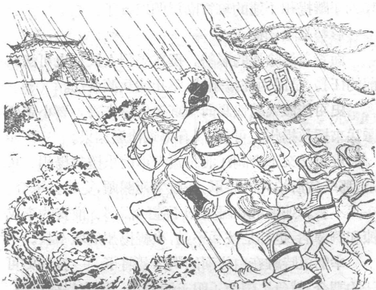
史可法帶領部下冒雨趕回揚州。