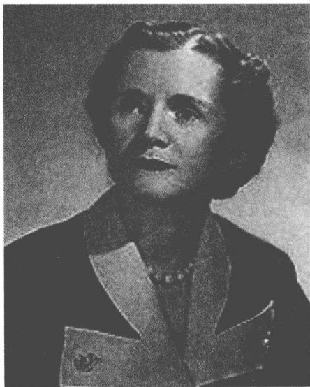
蕾切尔·路易斯·卡逊 (Rachel Louise Carson, 1907. 5. 27 — 1964. 4. 14)

在当今世界，尤其是在政府官员和环境保护工作者之中，不知道“卡逊”这位著名女性的人恐怕为数不多了。因为她的名著《寂静的春天》，可以说是世界环境保护运动的第一块里程碑。她以敏锐的视觉和理性的推断，向全世界的人们揭示了与繁荣的工业化社会滋生的“恐