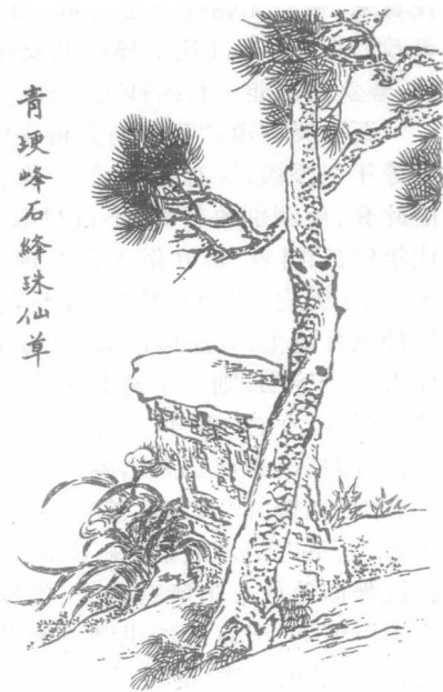
青埂峰石峰珠仙草