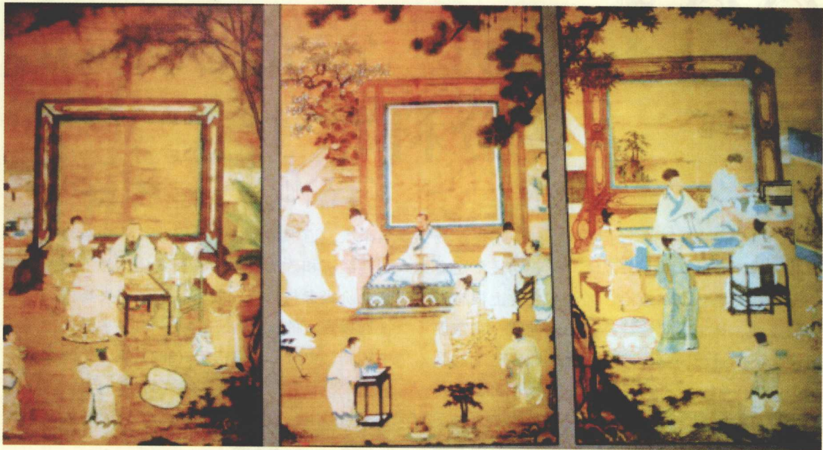
唐太宗十八学士中有不少是隋朝科举出身的

士科等，创建了进士取士，朝廷开设科目，士人自由投考，分科以考试成绩决定取舍的制度。《旧唐书》卷一九载，“近炀帝始置进士之科，当时犹试策而已”，揭开了科举史上的新篇章。隋炀帝大业二年（606），始置明经、进士科二科，试策小文，名之策学。当时主要考时务策，就是有关当时国家政治生活方面的政治论文，叫试策。这种分科取士、以试策取士的办法，是科举制创立的显著标志，这种通过考试把读书和做官联系起来的科举制度，是中国历史上选官制度的一大进步。大业三年（607）四月，炀帝诏令文武官员有职事者，以“孝悌有闻”、“德行敦厚”、“节仪可称”、“操履清洁”、“强毅正直”、“执宽不挠”、“学业优敏”、“文才秀美”、“才堪将略”、“膂力骁壮”等十项举人，随才升擢。该诏书已明确提出十类科举人的具体项目和标准。大业五年（609）正月，又诏令诸郡以“学业该通，才艺优洽”；“膂力骄壮，超绝等伦”；“在官勤慎，堪理政事”；“立性正直，不避强御”等四项举人。