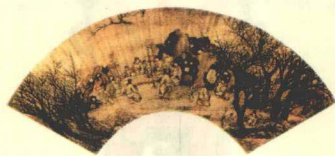
Illustration of Imperial Examination System