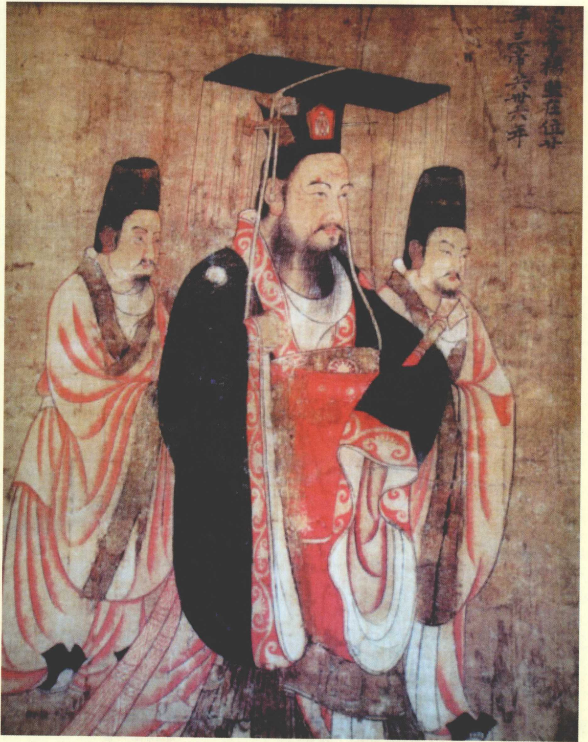
隋文帝开皇年间，分科举人，诏举特科，岁举秀才，开科举之先