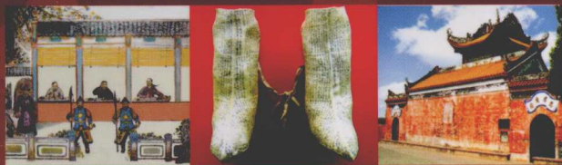
ILLUSTRATION OF IMPERIAL EXAMINATION SYSTEM

科举制度是历史的产物,它在封建社会不失为一项进步的社会制度,极大地影响了中外人才选拔制度,被命为中国的第五大发明。在扬弃了世袭、察举、征辟和九品中正制之后,科举制度为天下所有读书人提供了公开、公平的晋身之道。学子以自身之力获取功名,跻身国家管理者之列。金榜题名成为读书人的理想,而政府、家族乃至整个社会又给予中举者以很高荣誉,形成了一股激发全社会奋发向上的道德力量。