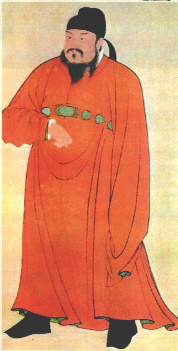
高祖武德五年，孙伏伽被高祖李渊点为状元，成为科举史上第一位状元

唐代平定天下后，唐太祖颁布了大赦令。但是不久之后，唐太祖又要处罚农民起义军的将领。孙伏伽进谏说：“王者无戏言。”往昔攻打天下