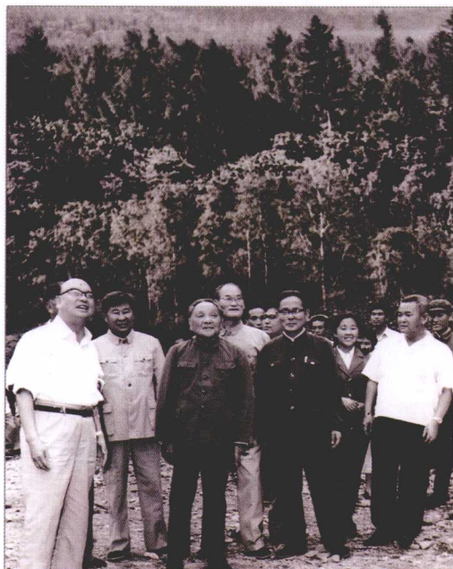
1983年8月13日，中央军委主席邓小平视察长白山自然保护区。