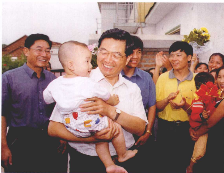
2001年8月，胡锦涛同志视察延吉市小营乡仁坪村，与朝鲜族农民亲切交谈。