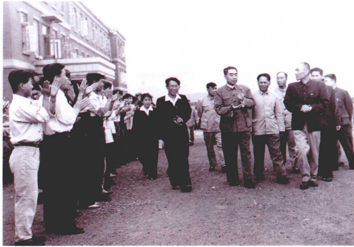
1962年6月23日，周恩来总理亲临延边农学院视察