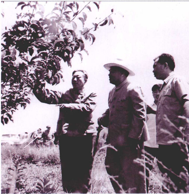
1964年夏，全国人大常委会委员朱德委员长在中共延边州委书记朱德海的陪同下，视察延边龙井果树农场。