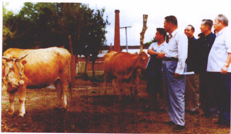
1983年夏，中共延边州委书记赵南起（前左）到延边农学院视察延边黄牛育种工作情况。