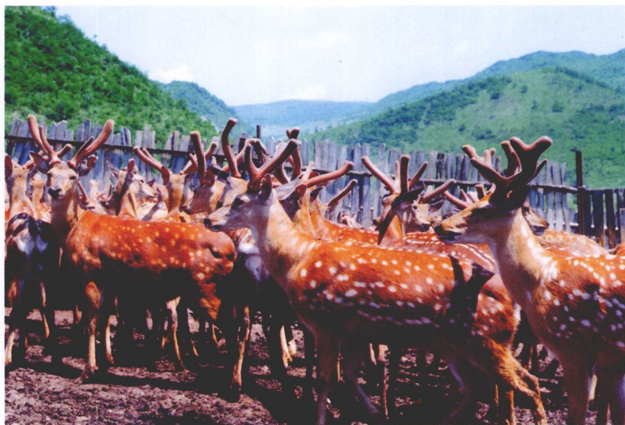
延吉市依兰鹿场的梅花鹿群。