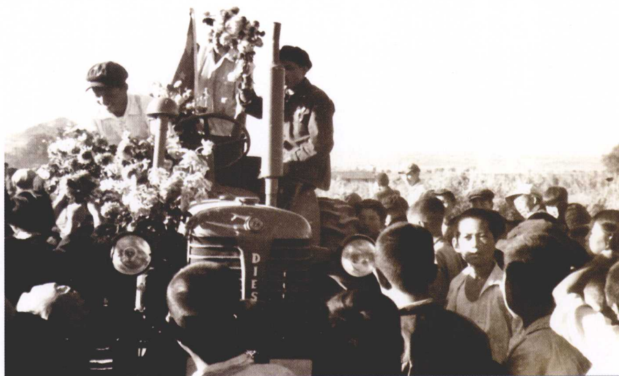
延边迎来第一台拖拉机的那一天（1954年9月31日）。