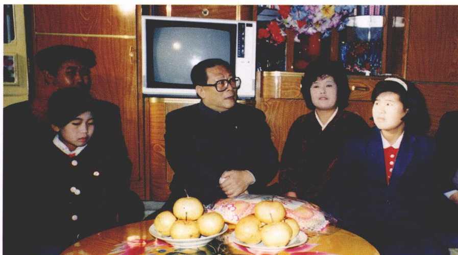
1991年1月7日，中共中央总书记江泽民视察龙井市东盛涌乡龙山村，在朝鲜族农民家里了解科学种田情况。