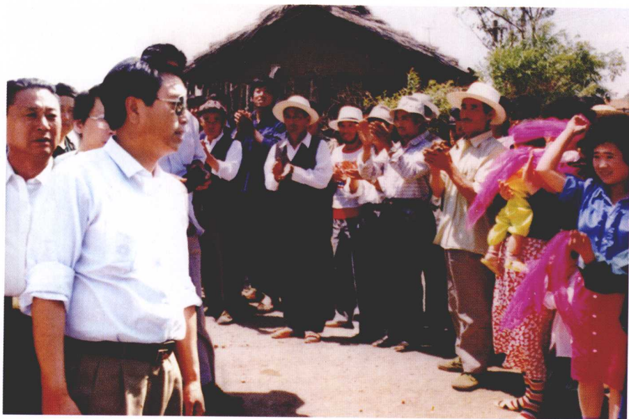
1991年6月18日，中共延边州委书记张德江（前一）到琿春市敬信乡防川村视察。