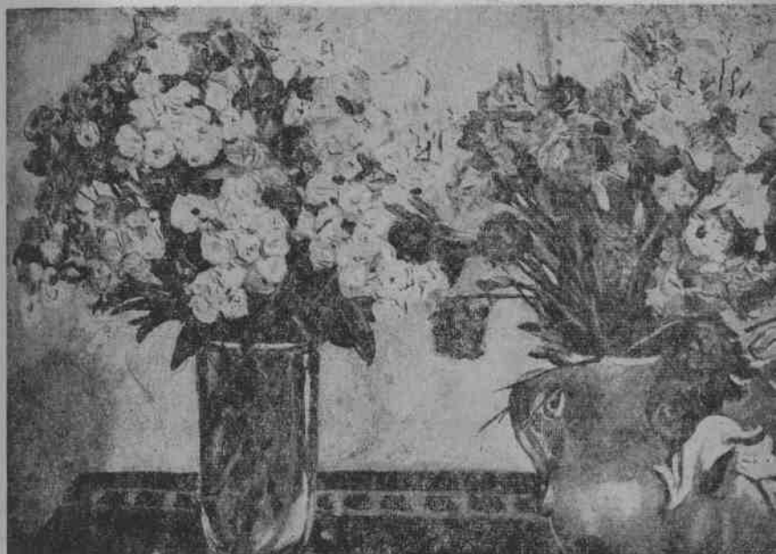
10. 代温卡：有福寿老花的静物。部分图。1943年作