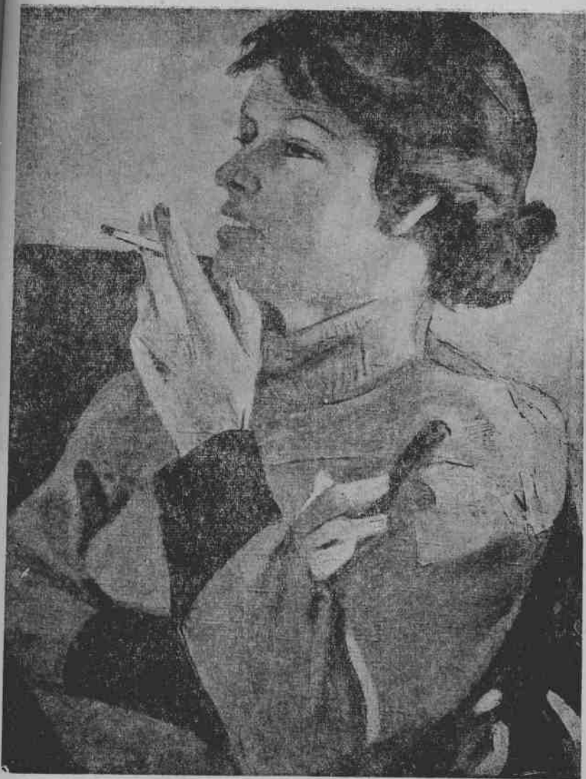
9. 代涅卡：妇女像。部分图。1940年作