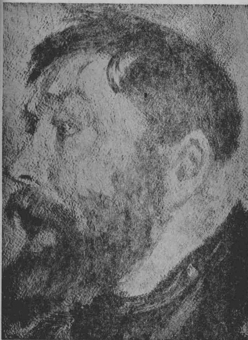
11. 約千松：苏維埃法庭。部分图。1923年作