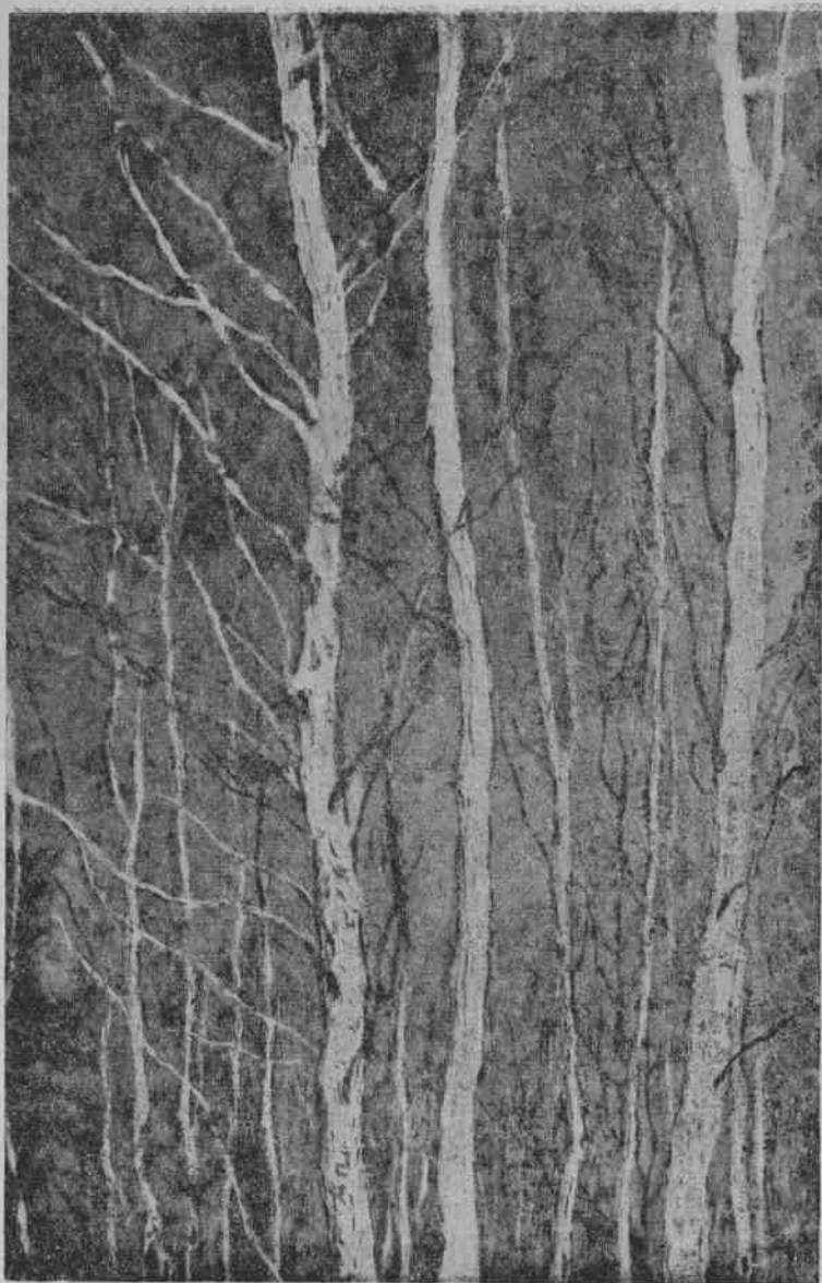
3. 巴克雪叶夫：天蓝色的春天。部分图。1937年作