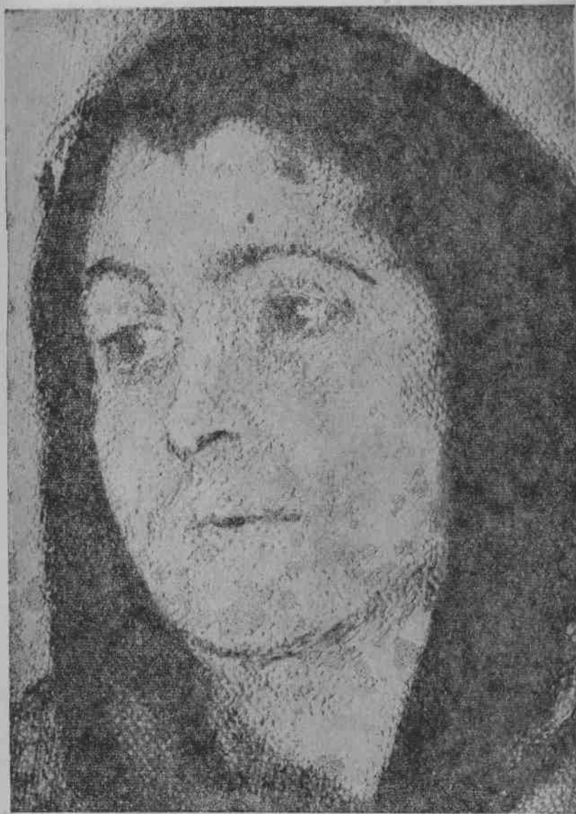
12. 約干松：苏維埃法庭。部分图。1928年作