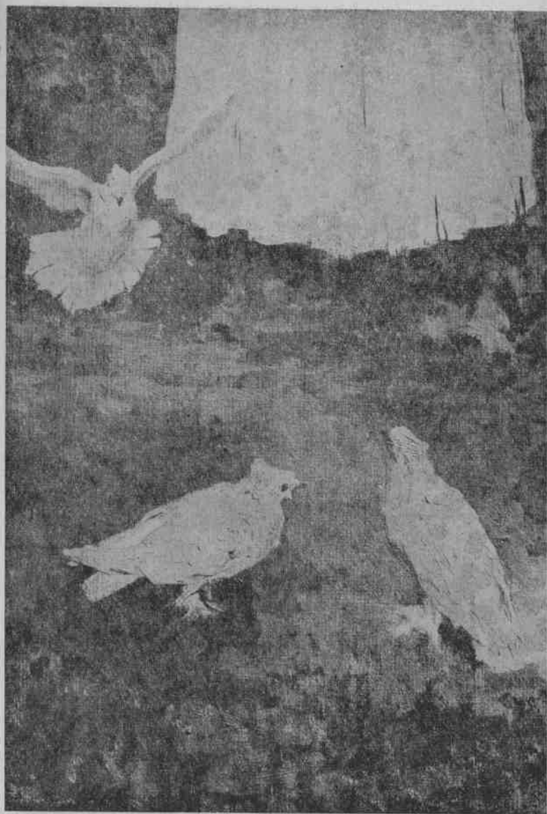
1. 巴克雪叶夫：少女与鸽子。部分图。1887年作