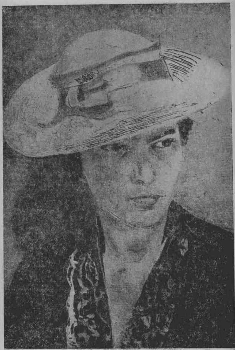
8. 代涅卡：戴麦杆帽子的人像。部分图。1936年作