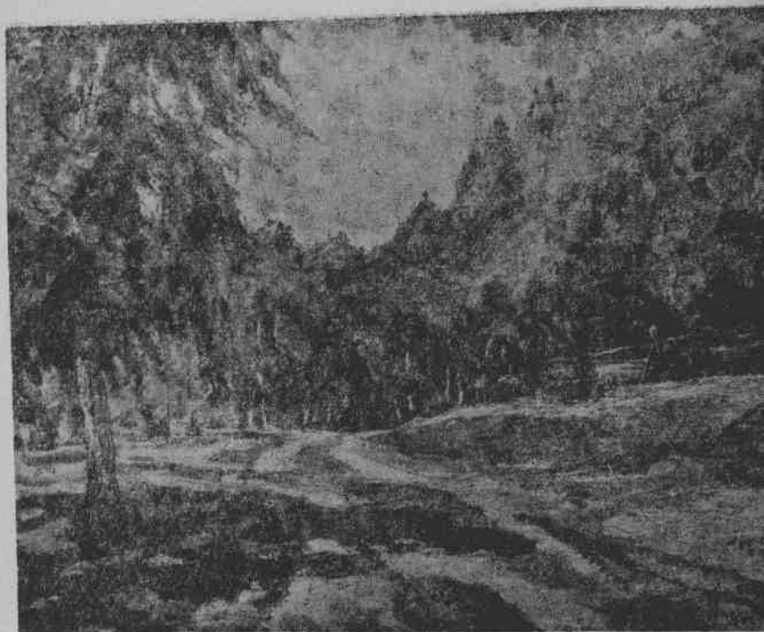
4. 巴克雪叶夫：村道。1954年作