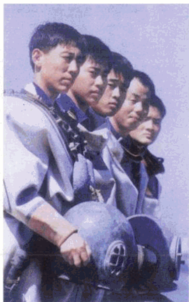
身负重任的潜水员