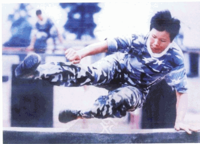
女陆战队员飞越障碍