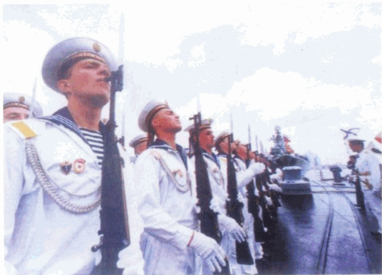
俄罗斯军舰上的仪仗队员