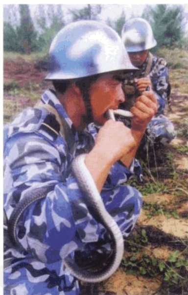
陆战队员野外生存训练