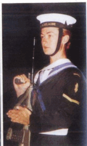
澳大利亚护卫舰上的女水兵