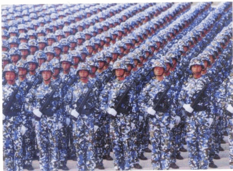
中国海军陆战队队员