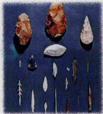
石器时代使用的工具

lòu le tā men huò qǔ de shí wù yě hěn yǒu 陋了，他们获取的食物也很有 xiàn kào dān gè rén de lì liàng méi fǎ shēng 限，靠单个人的力量没法生 huó zhǐ hǎo guò zhe qún jū de shēng huó gòng 活，只好过着群居的生活，共 tóng láo dòng gòng tóng duì fu měng shòu de qīn 同劳动，共同对付猛兽的侵 xī gòng tóng fēn xiǎng láo dòng de chéng guǒ 袭，共同分享劳动的成果。