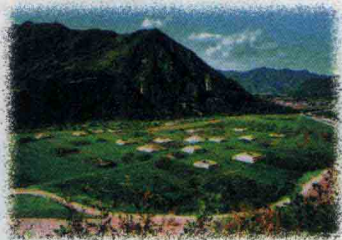
周口店北京人遗址

wǒ guó kē xué gōng zuò zhě zài zǔ guó 我国科学工作者在祖国 gè dì xiān hòu fā jué le xǔ duō yuán rén de 各地先后发掘了许多猿人的 yí gǔ hé yí wù de huà shí jīng guò cè 遗骨和遗物的化石，经过测 dìng wǒ men zǔ guó jìng nèi zuì zǎo de yuán 定，我们祖国境内最早的原