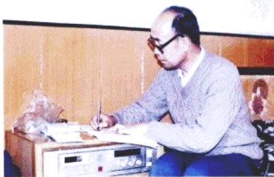
1995年冬，作者参加银南教育评估时，在旅馆写评课讲稿。▶