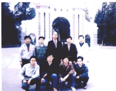
◀ 1992年，作者在全国人大会议期间前往清华大学看望在那里就读的中卫中学毕业生。