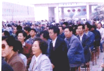
▲历年校友在会场上