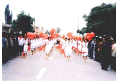
▲ 初中少先队员六一儿童节在大街上游行