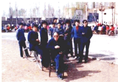
▲ 运动会中的终点裁判员们