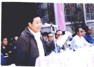
▲自治区人大主任马思忠讲话