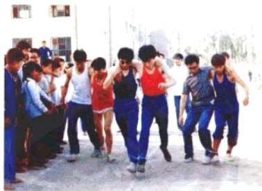
▲ 有趣的三足“绑腿”比赛