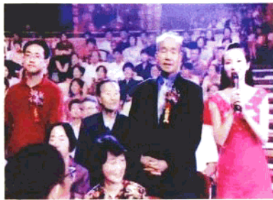
◀ 2002年北京师范大学百年校庆时，作者一家作为教育世家的代表在庆祝晚会上。