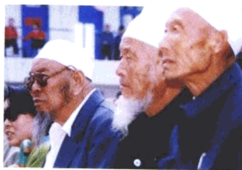
▲来自同心县的回民老校友