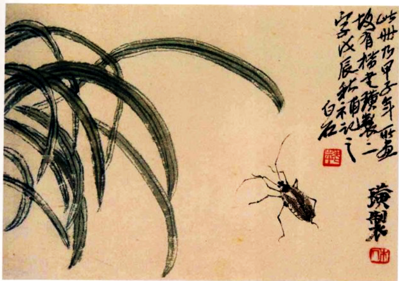
草虫图册(十开之四)