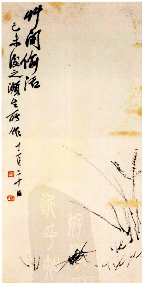
草间偷活图 40cm × 20cm 1919年