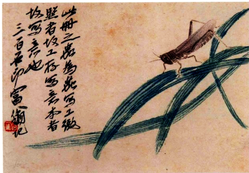
草虫图册(十开之一)