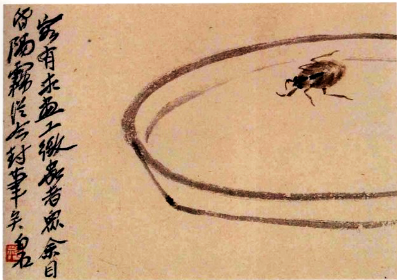
草虫图册(十开之二)