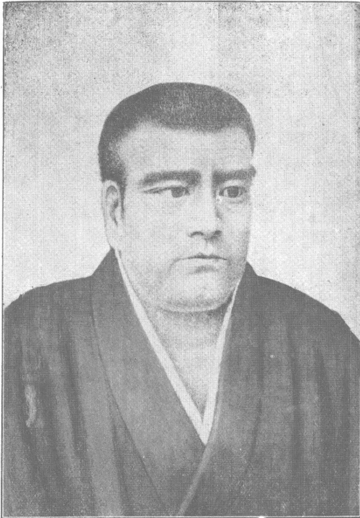
西 郷 隆 盛