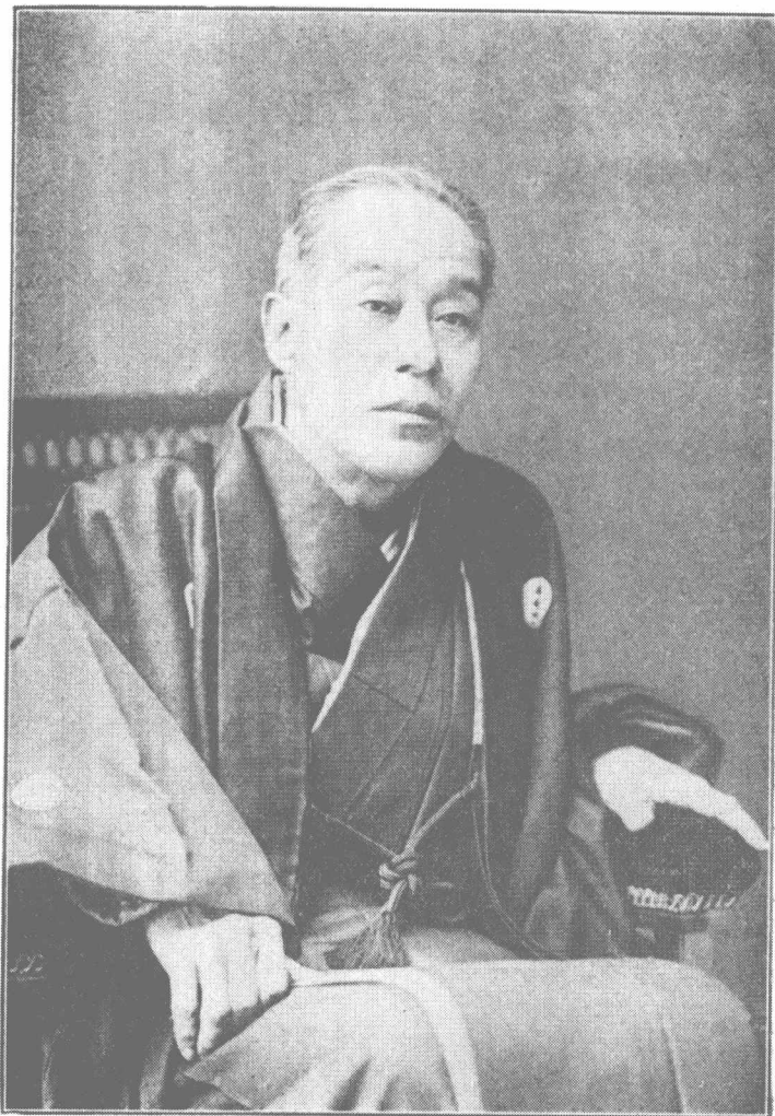
福 澤 諭 吉