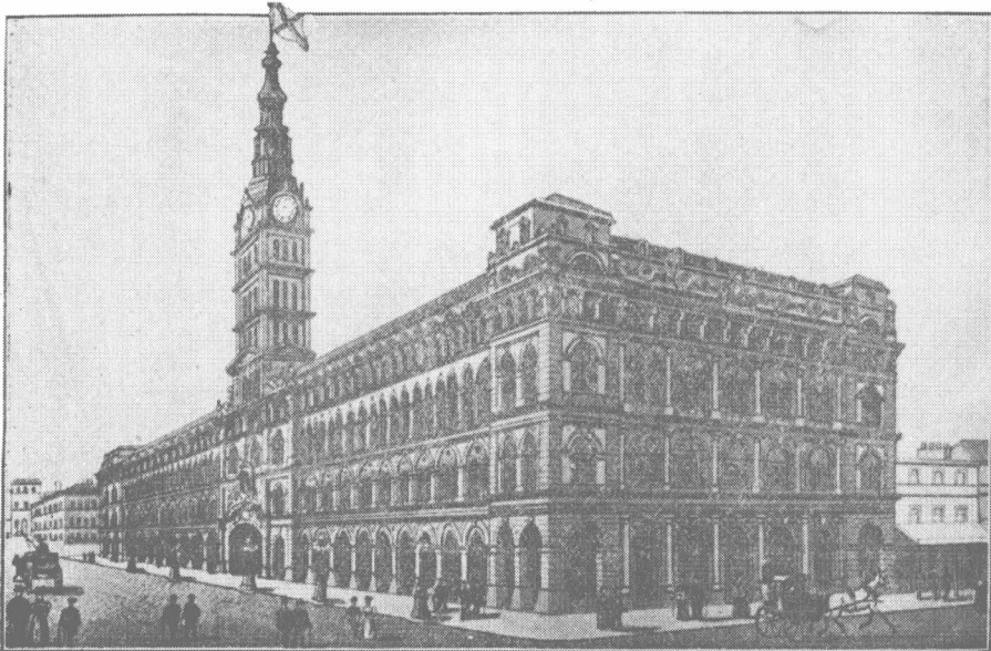
General Post Office .