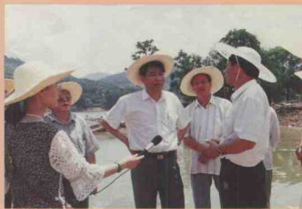
广东省副省长欧广源(中)在阳山县城关镇雷公坑管理区了解灾情