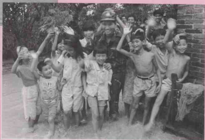
被解放军从洪水中抢救出来的乡村儿童