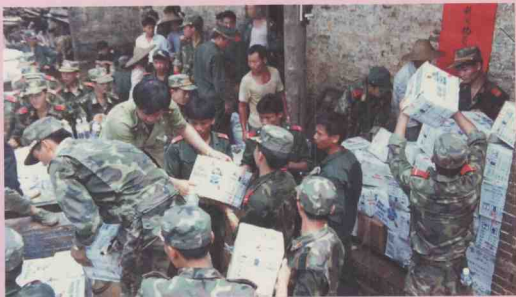
肇庆武警战士抢运救灾物资