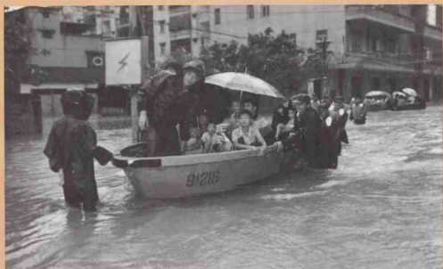
解放军战士抢救妇女、儿童