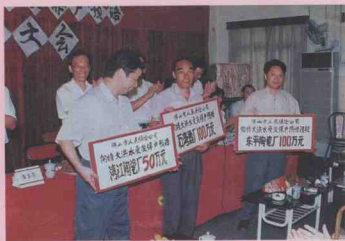
一批受灾企业及时领到保险预付赔款，迅速恢复生产