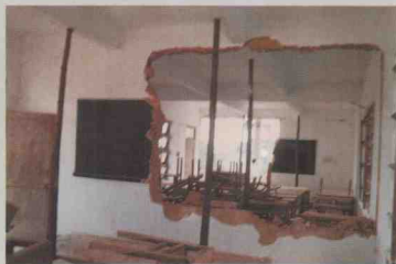
受台湾海峡7.3级地震影响, 饶平县河南学校课堂的墙 与水泥框架被普遍震裂