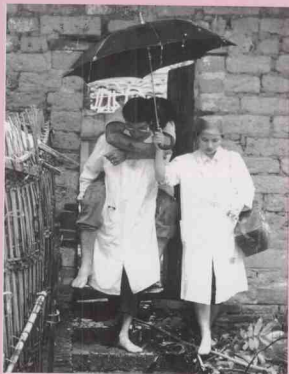
高州市救灾医疗队抢救受伤灾民