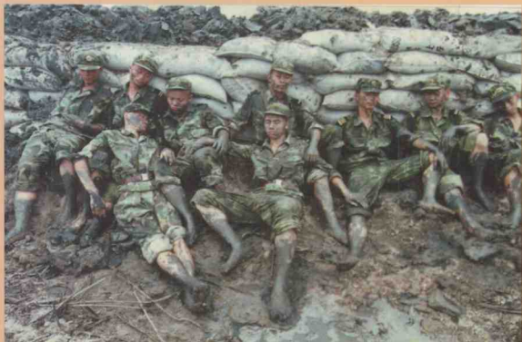
大堤保住了，抗洪战士们靠堤睡得又香又甜