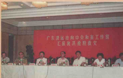
国务委员陈俊生(左四)、国家建设部部长侯捷(左五)、广东省省长朱森林(左三)等在北江大堤指挥部听取汇报