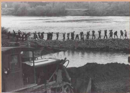
洪灾刚过，化州市灾民立刻抢修被洪水毁坏的堤围