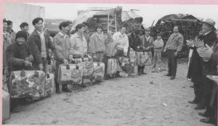
地方政府及时给灾民发放御寒毛毯