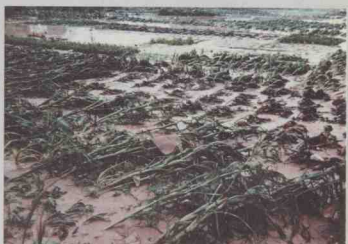
大片农作物被洪水冲毁