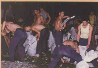
广州舰艇学院学员在抢修堤坝