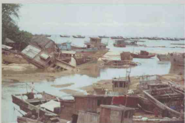
遂溪县草潭港渔船被山洪暴发的泥沙淹没