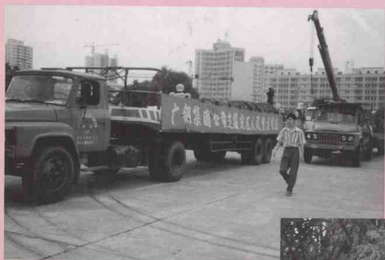
广州钢铁集团公司向灾区捐赠钢材