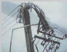
供电设施被9403强热带风暴吹毁