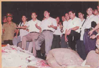
省委副书记黄华华(中)亲临抢险第一线