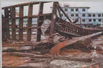
南海市沙涌某工地打桩机被龙卷风吹倒