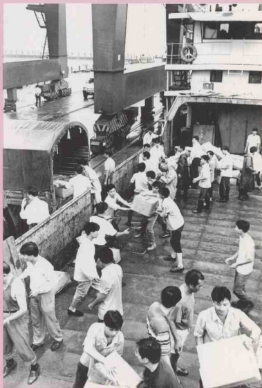
省民政廳緊急購買8萬件衣服、4萬件雨衣運送到肇慶災區