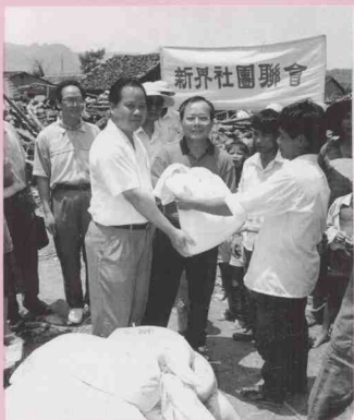
香港新界社團聯會向廣東災區捐贈救災物資