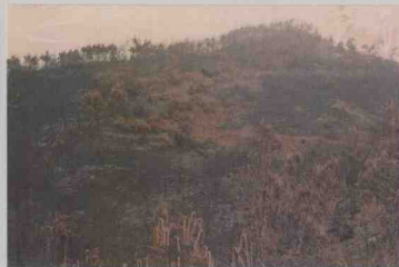
1994年3月29日海丰梅陇火迹地