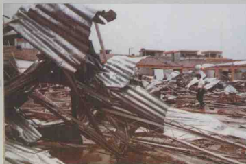
南海市里水沙涌农贸市场被龙卷风吹毁