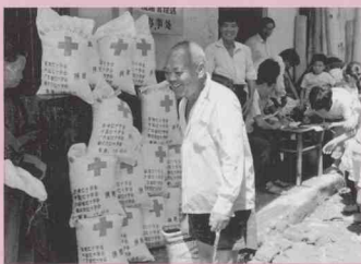
中共郁南縣都城鎮委、鎮政府將接受的賑災物資及時發放到災民手中