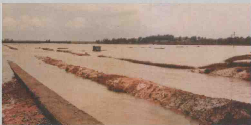
湛江水产局源围虾场全部受淹