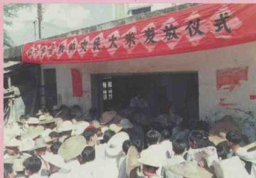
红十字会在清新区回澜镇发送救灾大米