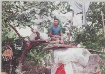
灾民树上暂栖身（清远市清城区）