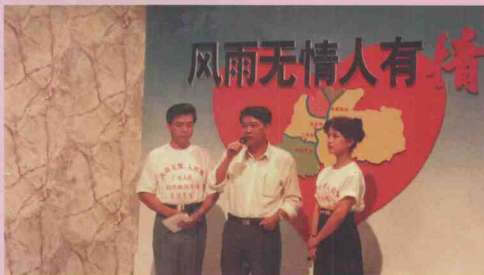
社会各界通报灾情和抗洪救灾情况 广东省副省长欧广源（中）向