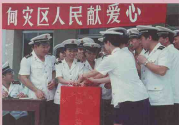
南海舰队机关干部、战士纷纷为灾民捐款