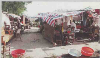
灾民暂宿山头（清远市清城区）