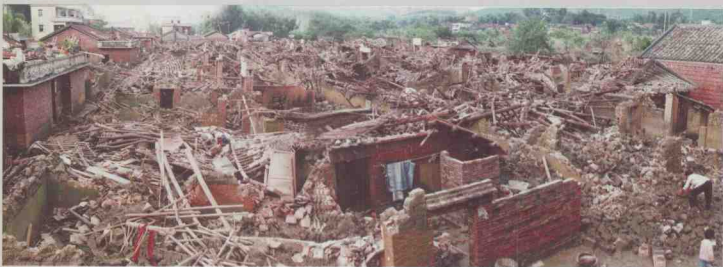
清远市清城区龙塘镇庙咀村被洪水冲塌的房屋