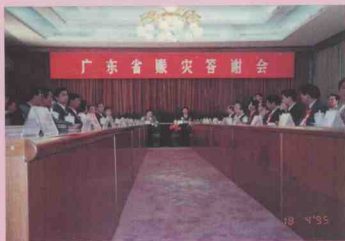
欢迎参加救灾答谢会的代表