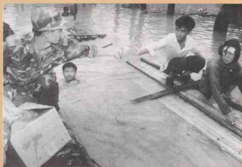
及时将干粮送到灾民手上