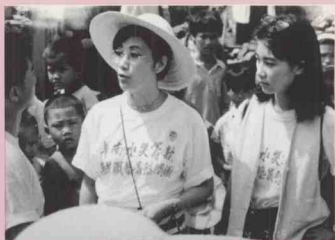
香港無線電視台“華南水災籌款”藝員慰問團成員深入廉江市橫山鎮和龍灣鎮慰問