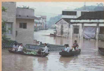
穿街过巷为灾民送菜