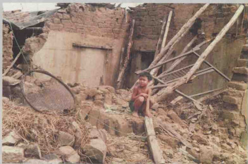
稚童面对倒塌的房屋（电白县）