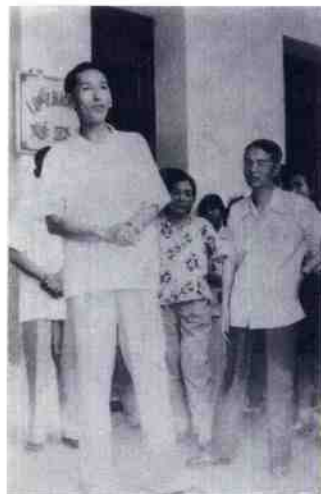
1990年4月,国务委员、国家教委主任李铁映到我院视察