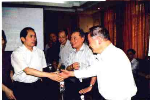
2000年9月,自治区党委副书记马庆生视察我院