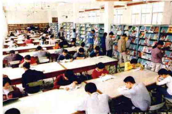
图书馆阅览室一角