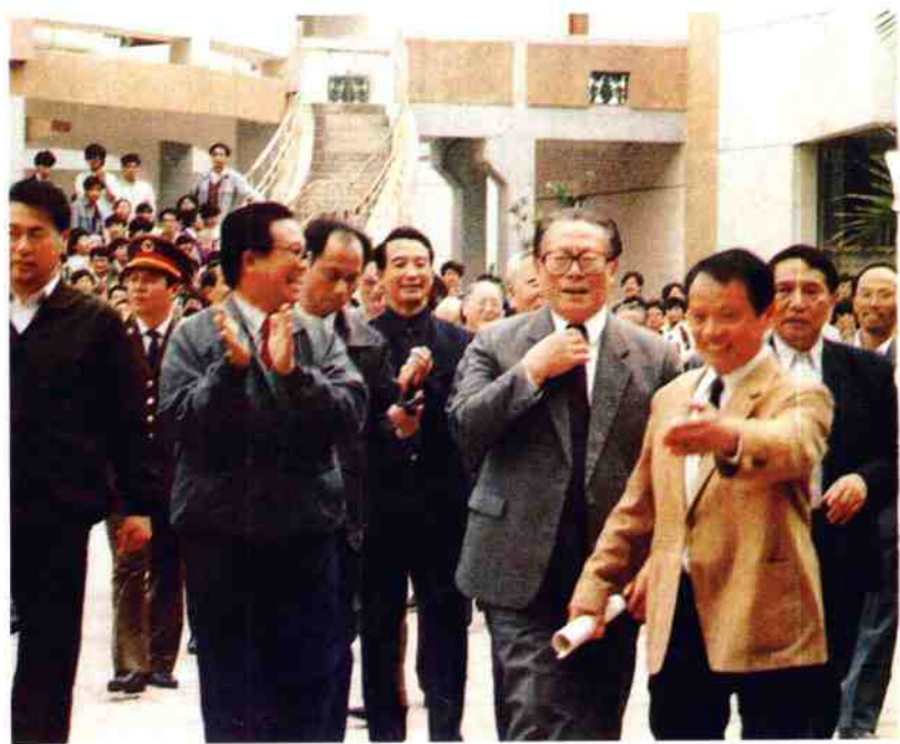
1990年11月,江泽民总书记来我院亲切看望各族师生员工