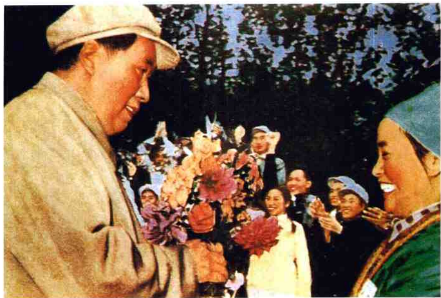
1958年元月,毛泽东主席在南宁接受我院各族学生代表献花