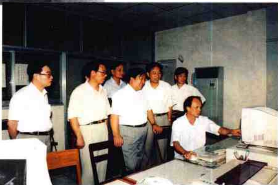
1997年6月，国家教 委副主任周远清视察我院