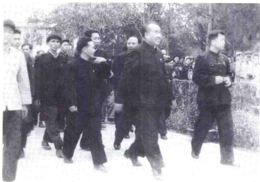
1959年年底,朱德委员长亲临我院视察工作