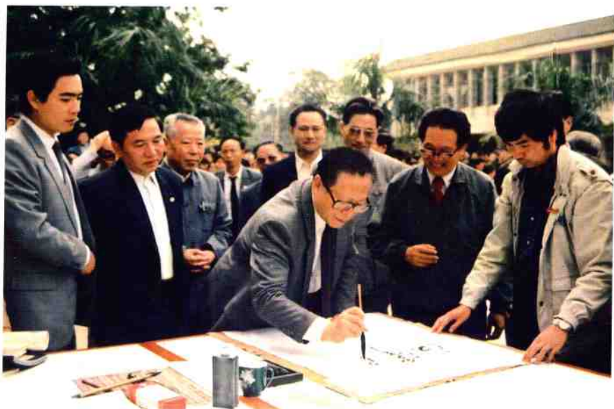
1990年11月,江泽民总书记来我院时为我院题字