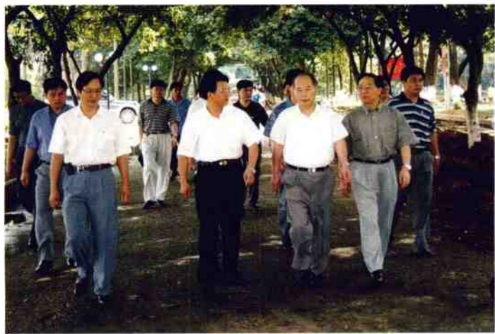
1998年5 月，中共中央政 治局常委、书记 处书记尉健行 来我院视察