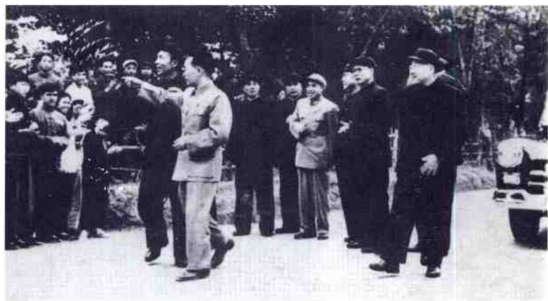
1956年，张云逸大将到我院视察