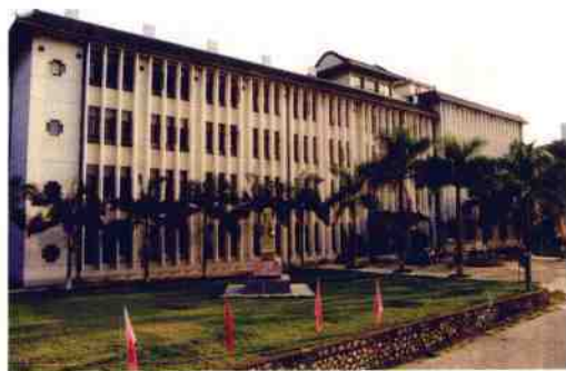
藏书近百万册的图书馆