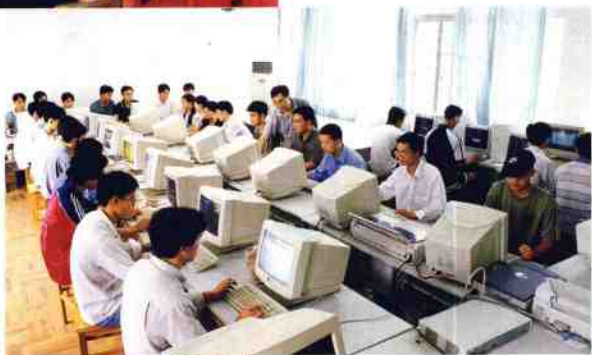
学生上电子计算机课