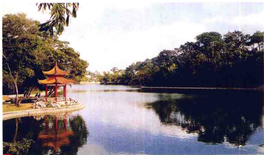
碧波荡漾的相思湖