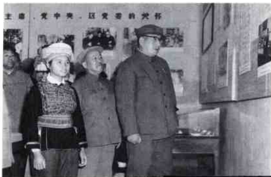
1979年9月，中央统战部 部长兼国家民委主任杨静 仁来我院视察民族教育工作