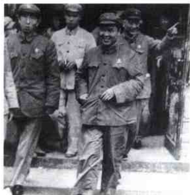
1968年，自治区领 导韦国清到我院视察