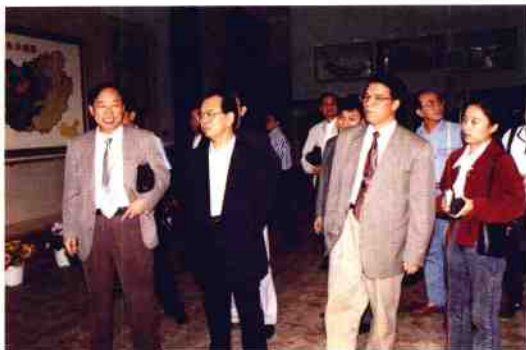
2002年4月,自治区政府主席李兆焯来我院考察调研