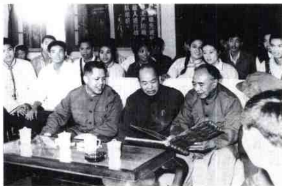
1980年，自治区 政府主席覃应机到 我院视察