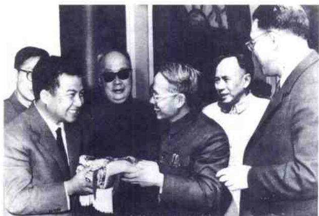
1963年，陈毅副 总理陪同柬埔寨西哈 努克亲王到我院访问