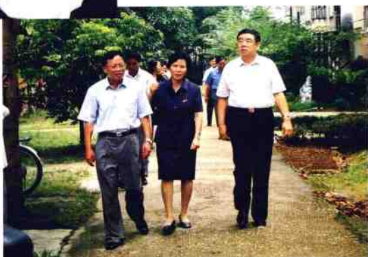
2001年11月,自治区政府副主席吴恒视察我院