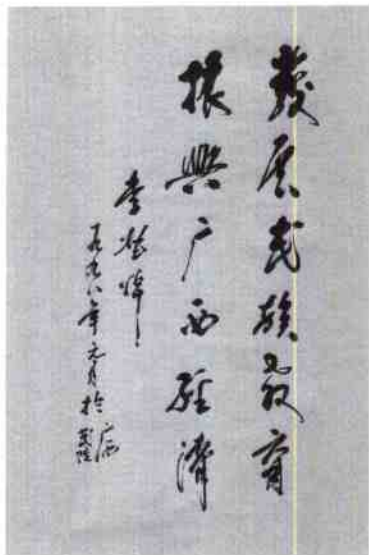
自治区政府主席李兆焯为我院题词