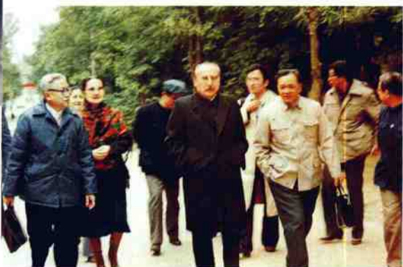
1984年12月,全国人大副委员长赛福鼎·艾则孜来我院视察