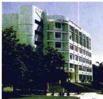
校友捐资兴建的校友楼