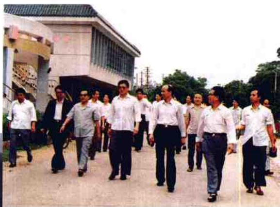
1965年,全国人大副委员长阿沛·阿旺晋美来我院视察