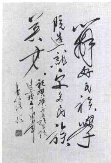
中共广西区党委书记、区人大主任曹伯纯为我院建院 50 周年题词