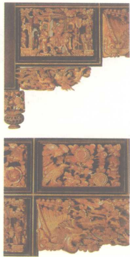
人物、花鸟厅堂门楣 潮州多层镂空金漆通雕（局部）