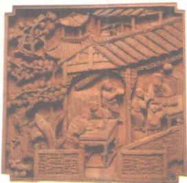
私塾·家居装饰件 清代徽州木雕