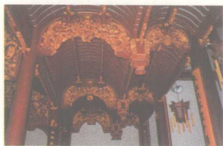
浙江上虞曹娥庙大殿梁架

建筑装饰木雕一般还可分为大木雕刻和小木雕刻两类。大木雕刻主要是指梁、枋、斗拱等构件上的装饰雕刻。我国传统建筑是以木材为主，从坚固耐用角度出发，很重视构架的组合方式，