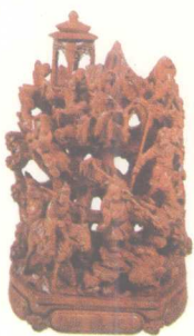
西游记 林行能 广东揭阳