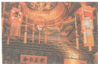
北京故宫养心殿蟠龙雕花藻井

除了建筑木雕装饰以外，民间小件工艺品雕刻方面也有较大发展。另外，木雕的突出成就，还表现在染织用的雕花印版和书籍的木版雕刻工艺上，这一时期的图书在我国的印刷技术史上占有很重要的位置，其中《营造法式》、《烈女传》、《耕织图》等在宋版图书中尤为著名。