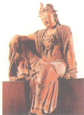
观音菩萨坐像 宋代