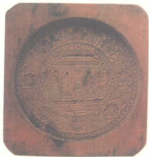
杂宝纹石榴型饼模 江苏

观赏型木雕的历史相对实用型木雕稍晚，在木雕艺术发展过程中，逐步脱离依附于生活、生产用品的装饰雕刻而成为一个独立的民间艺术类型，在功能和形式上与包括建筑木雕在内的实用型木雕有所不同，它主要是以表现人们对生活的理想和追求、满足人们精神需求和审美情趣为目