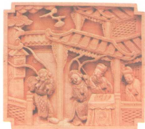
木兰归家·家居装饰件 清代徽州木雕

木雕艺术对于木材的要求很高，“三分下料七分做”说明材料的重要性。古代流传下来的木雕作品，如家具、陈设观赏用品、佛教用品及大型