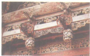
山西祁县渠家大院雕花门楼