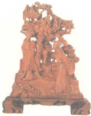
西厢记 广东梅州 丁茂旺