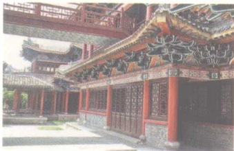
东阳木雕建筑样式（三）