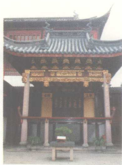
上海城隍庙内园戏楼

木雕按其功能的不同，大致可分为实用型木雕和观赏型木雕。实用型木雕包括了建筑装饰木雕、生活用品木雕等；观赏型木雕主要指室内陈