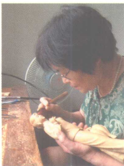
黄杨木雕修脸工序