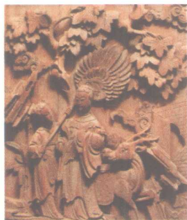
麻姑献寿·家居装饰件 清代徽州木雕