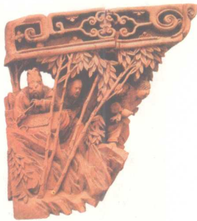
竹林七贤·透雕雀替 明代徽州木雕

而每一个部位都可以成为雕刻的对象。不论是梁、枋、檩、柱等大的构架，还是天棚、栏杆、门窗等，甚至门簪、牙子等小的部件，都能进行装饰雕刻。由于各种木构件位置、功能、形状的不同，用在这些地方的雕刻技法和题材内容也有所不同。屋梁，是木构架建筑中与立柱垂直相连的横跨构件，它承载着上架木结构及屋面的全部重量，是建筑构架中最重要的构件。屋梁因其位置、功能、形制的不同，又分为三架梁、五架梁、月梁、骑门梁、抱头梁等。与梁有关的附属构件，梁托、柁墩、瓜柱等常常被施以雕刻、彩绘等装饰。枋，是联系、固定柱子与梁的建筑构件，在整个梁架结构中起着重要作用。与枋类似的构件种类很多，有额枋、跨空枋、脊枋、金枋、随梁枋、穿插枋等。柱子，是建筑中最主要的构件之一，它同枋一样，也是直立承受着整个建筑上部所有的重量。柱子有圆形和方形等。建筑中考虑到枋、柱子等构件承重的原因，装饰雕刻一般多采用浮雕和线雕工艺，不同的是枋有时可以适当地使用镂空雕。这些构件雕刻常见的题材内容是仙花灵草、祥禽瑞兽、人物、如意纹、云头纹等。斗拱，是传统建筑结构的关键，它是建筑中位于屋檐下柱顶与额枋之间，以榫卯结构交错叠加而成的上大下小的构件，在室内梁、枋之间也常用到斗拱。斗拱具有分散梁架过于集中的重载和承担外部屋檐负重的功能。斗拱部位的雕刻多以半圆雕、镂雕为主，也常有彩绘装饰。雀替、撑拱，都是位于檐下梁、枋、柱部位的构件。雀替在建筑中位于柱与额枋相交处，做成榫子形状插入柱内，主要起到承托额枋、减少额枋跨度，增大额枋榫子受剪面积拉接额枋的作用。雀替一般是对称的形状，看上去像张开的双翼依抱于柱子的两侧。撑拱，俗称“牛腿”，是在檐柱外侧倾斜走向支撑挑檐檩的构件。最初的撑拱