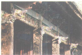
山东聊城山陕会馆正殿 抱头梁、穿插枋

余地，待完成全部雕刻后再剔去“地”。雕刻实还是根据作品的形象，把多余的地方雕刻掉，使作品的形象清晰起来。精心修饰是在实坯的基础上对人物脸部五官、肌肉、衣纹等细部进行反复细刻使之完整优美。精心修饰之后还要用砂纸打磨，打磨好的作品还要用核桃油等进行打蜡上光，有些浮雕作品还要进行油漆。最后是为创作好的作品配上底座和装上配件，底座和配件的要求是比例适当、色泽相称，能很好地起到对作品本身保护衬托的作用。