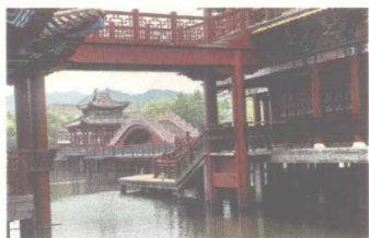
东阳木雕建筑样式 (二)

设品和小型摆件等。任何艺术形式都来源于生活，为人们的生活和生产服务，同时也随着社会的发展而不断变化，木雕也不例外。在这个艺术门类萌芽之时，最初出现的是实用型木雕，主要是满足人们生活、生产的需要。随着时代的发展、社会的进步，人类对精神生活的需求更多、更高，与之相应，作为满足这方面需求的观赏型木雕逐渐成为独立存在的艺术种类。而作为实用型木雕，尤其是其中的建筑木雕在社会发展过程中也发生着由盛到衰的变化，特别是近些年因人们居住理念、环境和条件的变化，建筑形式、建筑技术、建筑材料等的变化，传统的木结构建筑在现实中已不多见，建筑木雕也失去了依附的形式，又因为建筑木雕的特殊功能、技艺和专业知识的近失传，不被人们所了解，而逐渐从人们的生活中消失。为了不使这门优秀民间艺术就此消亡，有必要大力宣传、努力推广，以加深对它们的了解。