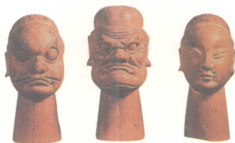
木偶头雕刻 福建泉州