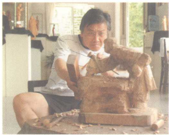
黄杨木雕工序之一