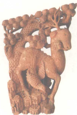
松鹿同春·浮雕雀替 清代徽州木雕