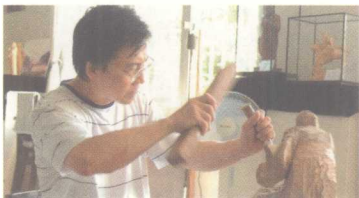
黄杨木雕工序之二