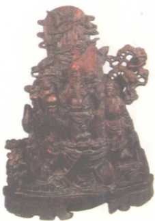
福祿壽三星 潮州木雕