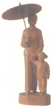
护送 (黄杨木) 浙江乐清 童玉凤

的建筑木雕，材料都首先选用质地较硬的名贵木材，如紫檀、樟木、黄花梨木、红木、楠木、黄杨木等。紫檀，也称“青龙木”，切面呈棕紫色，坚硬细致，古朴典雅，是木雕所用的珍贵木材。樟木，也叫香樟、红樟、灰白樟、乌肚樟，在多种樟木中尤以黄樟木木质坚韧细腻，纹理清晰，不变形、不虫蛀，最适合木雕。黄花梨木，又称花榈、降香黄檀，木质坚实，颜色以浅黄到紫赤，现在已不多见。红木，质地坚硬，纹理细密，适合做家具和小件木雕艺术品。楠木，分为水楠木、香楠木、金丝楠木，其中以金丝楠木最为名贵，其木质坚硬、不虫蛀、不腐朽。黄杨木，也称“瓜子黄杨”，其生长周期长，木质坚韧细密，色泽纯正……木雕的种类不同，所选的木材也不同，家具、神器、观赏型木雕选用的材料多为红木、花梨木、樟木、核桃木、梨木、松木等。建筑木雕选用木材多为楠木、柏木、松木、杨木、红松木、椴木等。由于以上这些材料中有的十分珍贵，在一般建筑用材和装饰雕刻中不可能大量使用，因此并不多见。而在选择、使用这些材料时，还要考虑到建筑的不同部位和装饰雕刻的具体要求。一般最常见的建筑木雕使用的材料以硬杂木居多，如榆木、柞木、楸木、红松木、椴木、杉木等，这样的选材符合建筑力学的要求，也适于进行装饰雕刻。