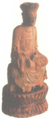
地藏菩萨像 明代 云南