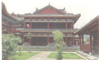
东阳木雕建筑样式 (一)