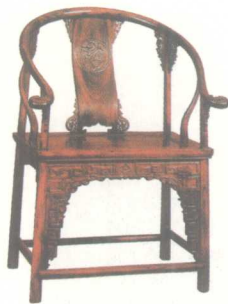
硬木雕花圈椅 浙江临海