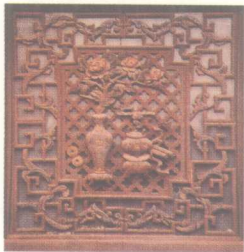
山西常家庄园进士第正屋窗 “福、禄、寿”博古图

浙江东阳是我国木雕传统产地，被称为“木雕之乡”，当地盛产樟木等适合雕刻的木材，也成就了东阳木雕。东阳木雕始创于唐代初期，建于北宋建隆二年（961）的东阳南寺塔中遗留的佛像可以作证。另据民间传说，东阳木雕的产生还与鲁班师傅有关，唐代东阳著名工匠华师傅为当地冯氏兄弟造厅堂，上梁时发现180根楠木大梁全都短了一尺三寸，这个时候有一个老翁上门讨鱼肉吃，华师傅款待了他，饭后，老人把两条鱼放在两只碗上，鱼头伸出，共同衔住一根筷子，摆好后扬长而去。华师傅看后马上明白了老人的用意，命人做了360个鱼头，固定在柱子头