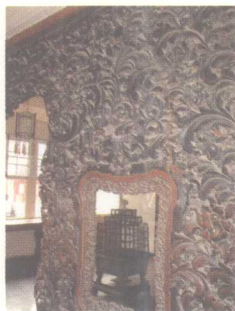
北京故宫丽正门门罩