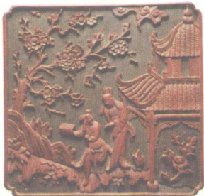
踏雪寻梅·家居装饰件 清代徽州木雕

的艺术种类。主要的功能是让人们在日常生活通过自己的聪明才智和创造力，美化生活和居住环境，陶冶人们的性情，使他们得到艺术的享受。观赏型木雕多以独立的形式存在，题材内容和雕刻技艺与实用型木雕大致相同。在建筑形式和人类居住环境发生巨大变化，建筑木雕逐渐淡出建筑装饰方式的时候，观赏型木雕作为一门优秀的民间艺术反而得到大力继承和发展，在雕刻技法、题材扩展等方面都有很多改革和发展，日益显示出它独特之处和在美化人们生活、陶冶人们的性情中起到的重要作用。