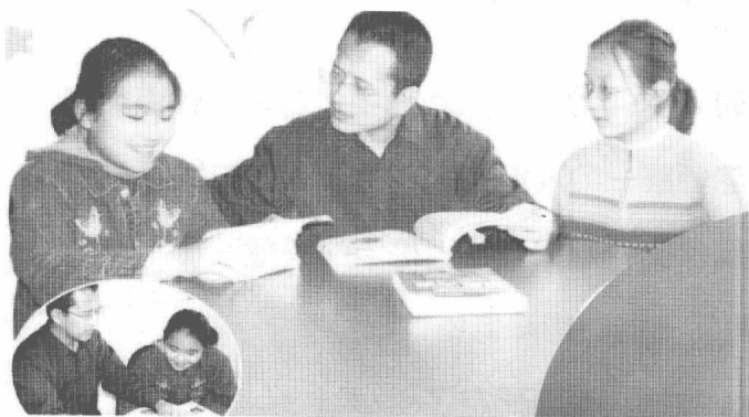
▲ 方洲老师辅导学生如何写作