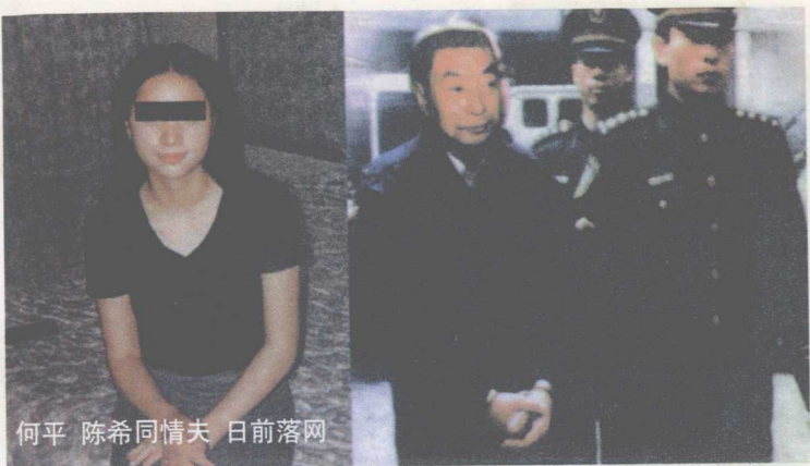
何平 陈希同情夫 日前落网

陈希同辞职后一直在北戴河软禁中交待问题，立案后转入公安部秦城监狱。不久前因心脏病到复兴医院（前公安医院）就医，等待他的将是1981年审判四人帮以来中共最高级别的审判。