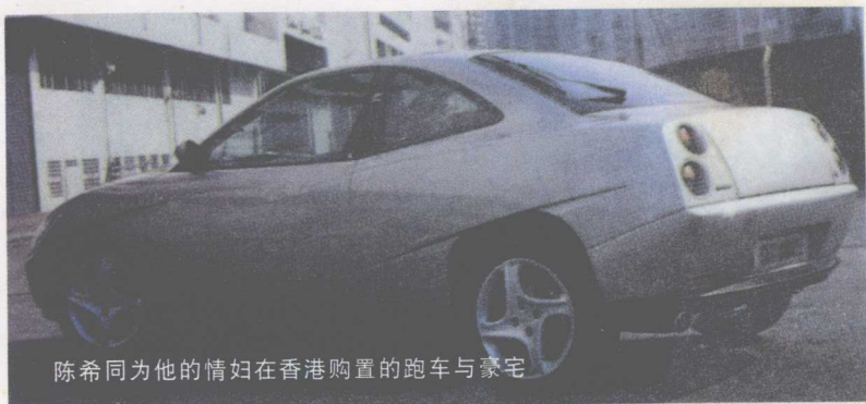
陈希同为他的情妇在香港购置的跑车与豪宅

陈希同辞职后一直在北戴河软禁中交待问题，立案后转入公安部秦城监狱。不久前因心脏病到复兴医院（前公安医院）就医，等待他的将是1981年审判四人帮以来中共最高级别的审判。