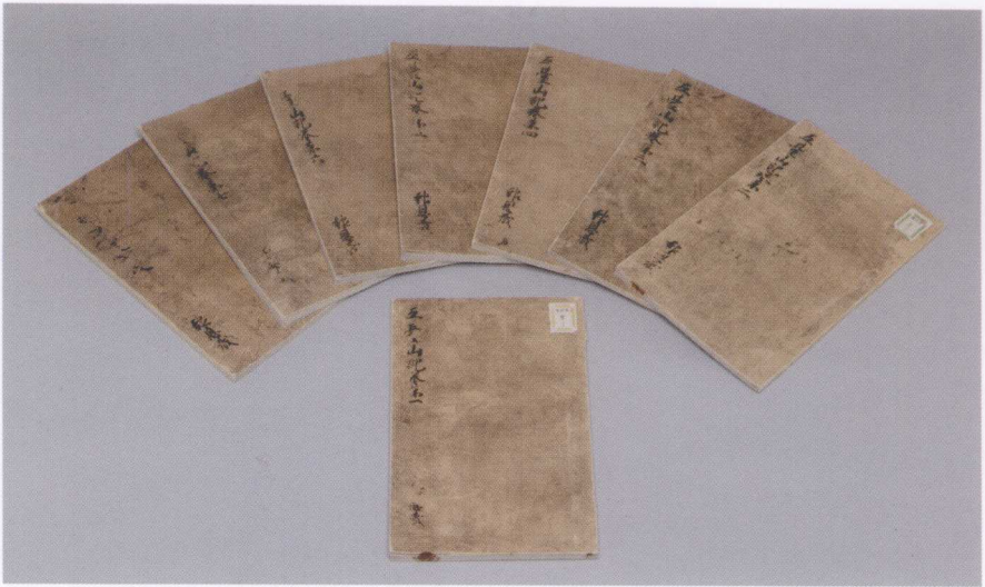
日本京都東福寺藏手抄本之複製本