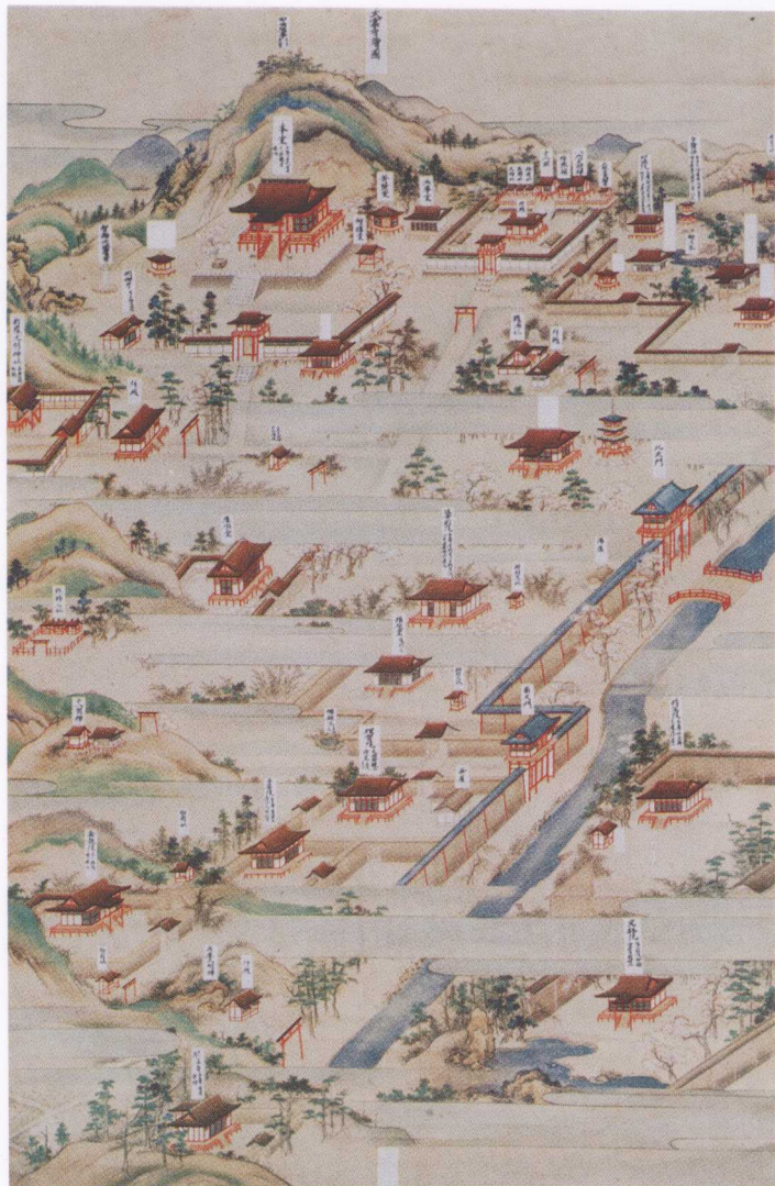
大雲寺古繪圖 日本實相院藏