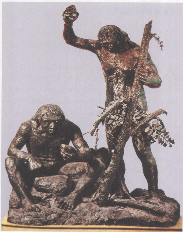
1-1 北京人采集生活想象图。