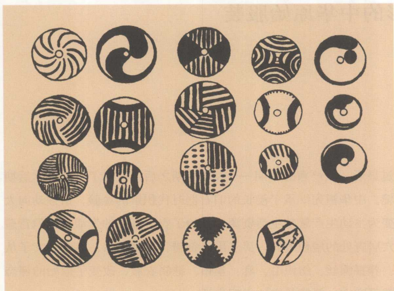
1-3 湖北天门石家河遗址出土彩绘纺轮(属屈家岭文化)。