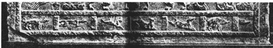
这是我国山东济宁发现的约 1900 年前(东汉时期)的浮雕，同今天的动画非常相似

如果仅从画面给人运动感这一点出发的话，动画片的起源可以追溯到几千年甚至数万年之前。在原始人的壁画中，就有人画下了八条腿的野兽，这既是原始人观察飞奔的走兽的结果，也是人类试图描绘出具有动感的物体的结果。古希腊和古罗马人在他们的神庙或竞技场的墙壁上画了具有连续动作的人物，当人们走过或飞马驰过的时候，便会产生一种图画活动起来的感觉。古代中国人的走马灯尽管旋转的速度不是很快，但还是能产生人物动起来的感觉。在摄影技术出现之前，捕捉和留住动态的事物是人们的一个梦想，无数的人使用了无数的办法希望能复制一个动态。这个梦想经历了无比长久的时间，终于在 19 世纪，随着科学技术的进步开始逐渐成为现实。