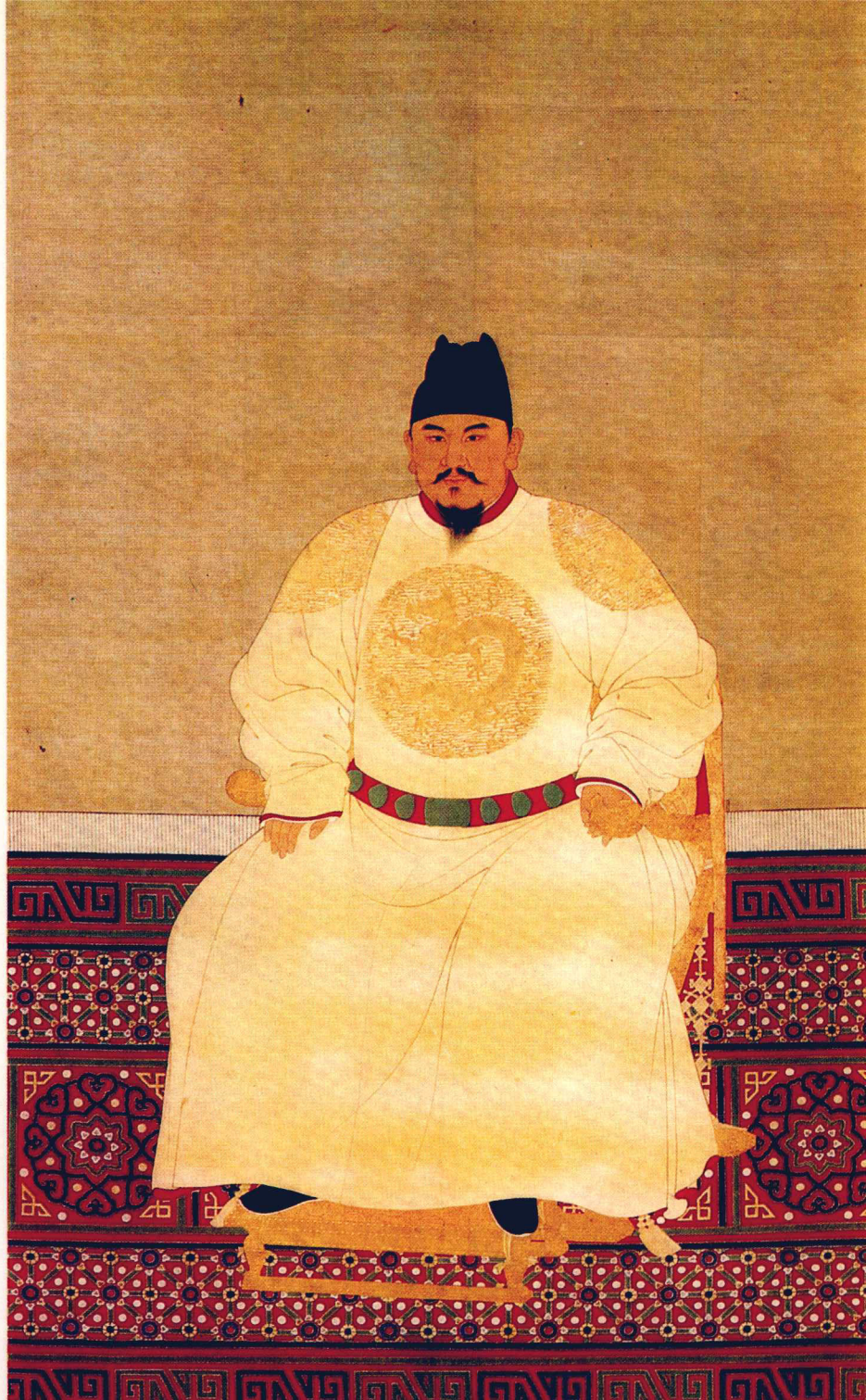
① 明太祖朱元璋坐像。