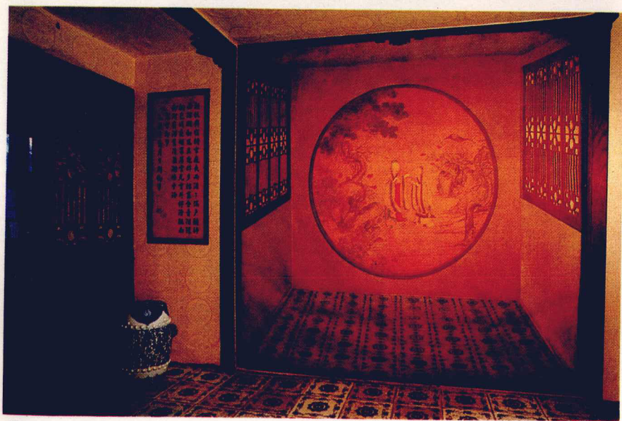
⑬ 養心殿內三希堂（上）和三希堂外間。