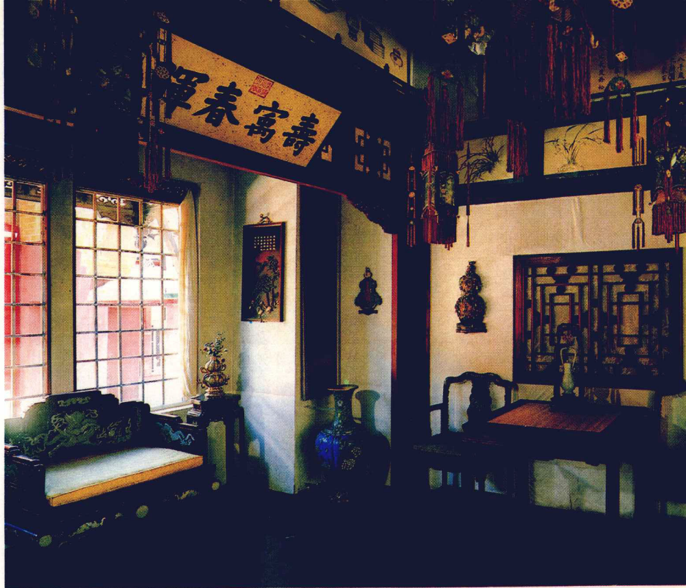
⑫ 紫禁城養心殿東暖閣(上)和西暖閣(下)。