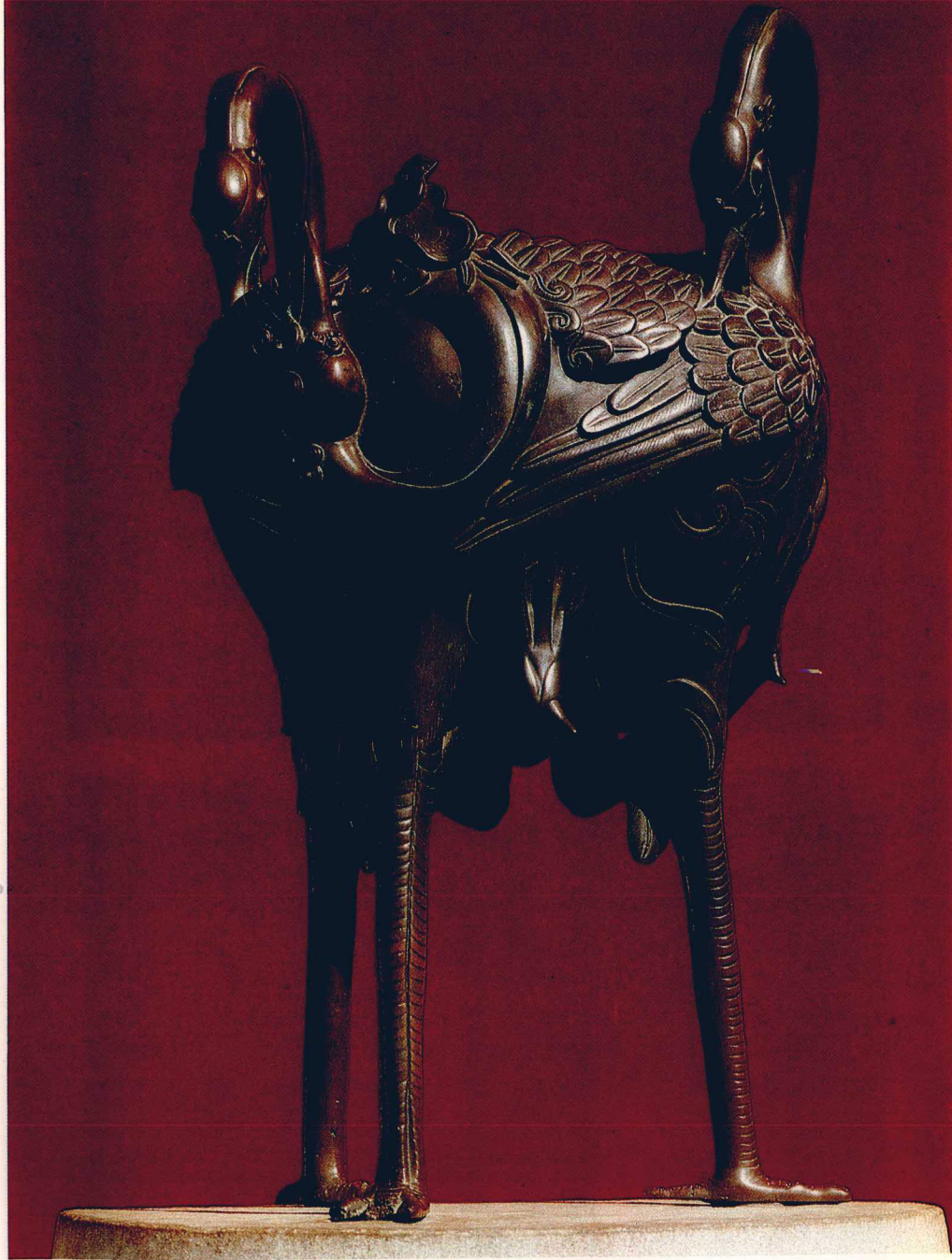
⑭ 養心殿前三頭鶴香爐。