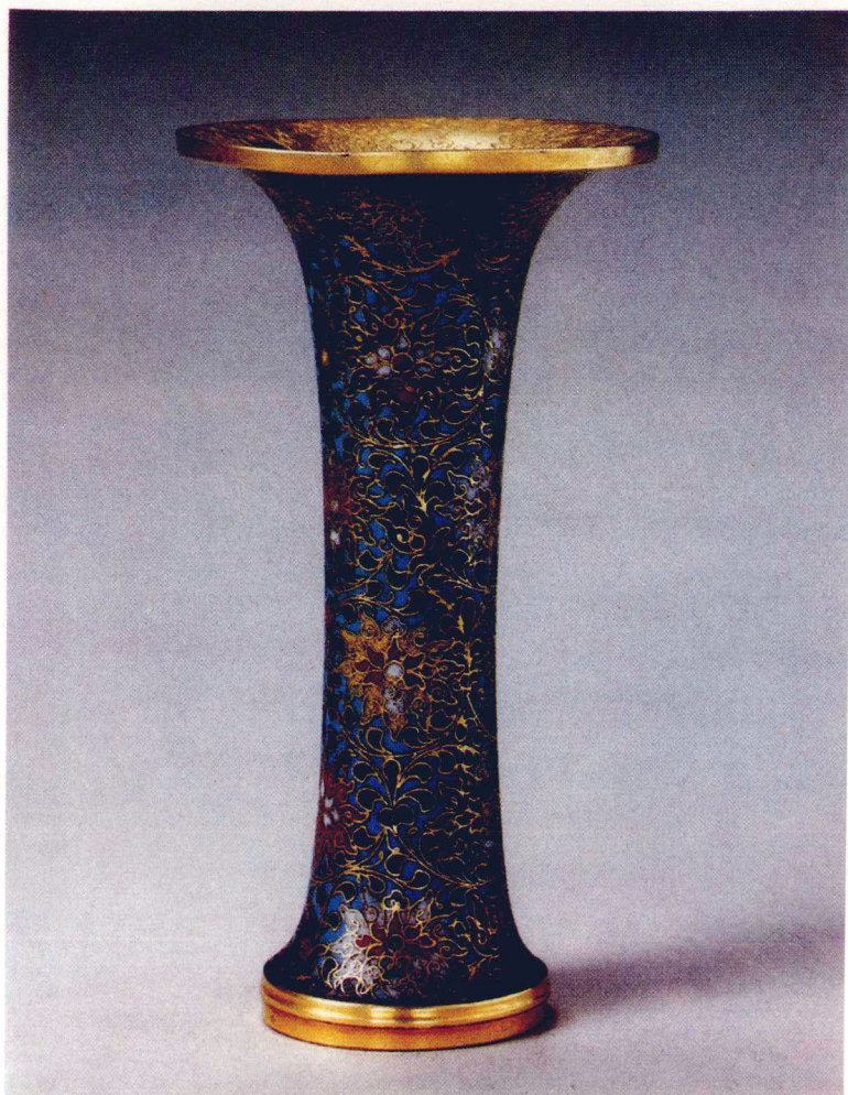
⑨ 銅招絲琺瑯纏枝蓮觚。