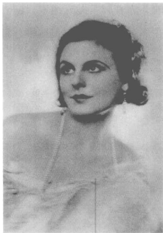
希特勒最喜欢的导演、德意志第三帝国最才华横溢的女人——瑞芬舒丹。

1999年，雷妮·瑞芬舒丹（Leni Riefenstahl）97岁了，可全世界，包括她自己都明白她活着或死去都无法摆脱一个死了有半个多世纪的人——希特勒。在回忆录里，她说：“人们无休无止地问我是不是和希特勒有罗曼史，是不是希特勒的女友。每次，我都笑笑告诉他们，那是谣言，我不过为他制作了纪录片。”但问题是，她很美，她为希特勒制作的纪录片很美，她是希特勒最喜欢的导演，德意志第三帝国时代最才华横溢的女人。