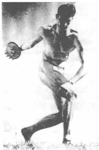
《奥林匹亚》把竞技变成宗教，然后又把宗教变成“意志的胜利”。

之后，她受国际奥委会所托，为1936年在柏林召开的奥运会拍摄一部纪录片，《奥林匹亚》（ Olympia , 1938）因此成了她的经典之作。1938年4月20日，《奥林匹亚》首映，正好是希特勒的49岁生日。她的这份辉煌礼物后来在电影史上得过四个大奖，但同时也永远地成了她的污点，因为在当时和现在的众多影评人看来，她把“奥运会转化成了法西斯仪式，旁白中不断出现的‘战斗’‘胜利’字眼，都透露了创