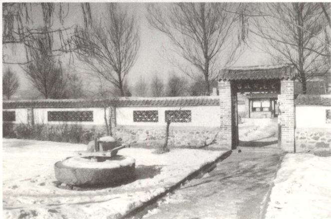
努尔哈赤的父亲塔克世在赫图阿拉城内的故居

古勒城中，父子俩同时被明军误杀。塔克世故居在赫图阿拉古城内，为一小小四合院，泥墙草房。嘉靖三十八年(1559年)，努尔哈赤就诞生在这里。努尔哈赤少小聪明，通晓汉文和蒙古文，青年时采集山货，多次到辽东马市交易，进京朝贡，24岁承袭父亲职务，任建州左卫指挥。后以13副遗甲起兵，经过11年征战，基本完成统一女真各部的大业。他具有远见卓识和创新意识，在征战的同时，发展农业和手工业，同汉族互市交流，创制满族文字，建立具有军事、行政和生产三种职能的八旗制度，1616年在赫图阿拉称汗，国号大金，史称后金。1625年迁都盛京(沈阳)。1626年在攻打宁远城时受伤，同年逝世，被尊为太祖武皇帝，后改谥为太祖高皇帝。