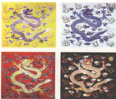
正黄旗、正白旗、正红旗、正蓝旗旗帜

镶蓝旗,满洲八旗之一,始建于1615年,因旗色为蓝色镶红边而得名。顺治初年,定为下五旗之一。到清末,发展到2.7万丁,男女老幼共有13.5万人。