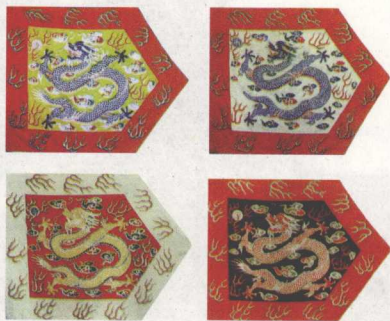
镶黄旗、镶白旗、镶红旗、镶蓝旗旗帜