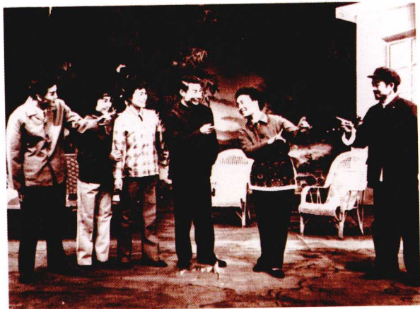
黔剧《三喜临门》 毕节地区黔剧团供稿 (1985年)