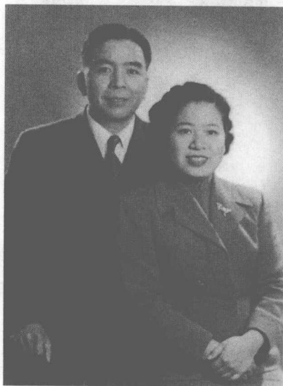
爸爸妈妈刚到香港时摄(1948年)。

确实，论聪明，论长相，我在四姐妹中都不突出，细想想，只因为我排行老大，长女的身份，确实更多地抓住了爸爸的眼球，妈妈曾告诉我，她和爸爸婚后七年才生下我，难怪爸妈对我特别疼爱、特别关心。