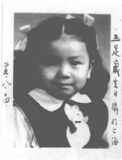
爸爸在我三岁生日时所摄照片上亲笔留字。