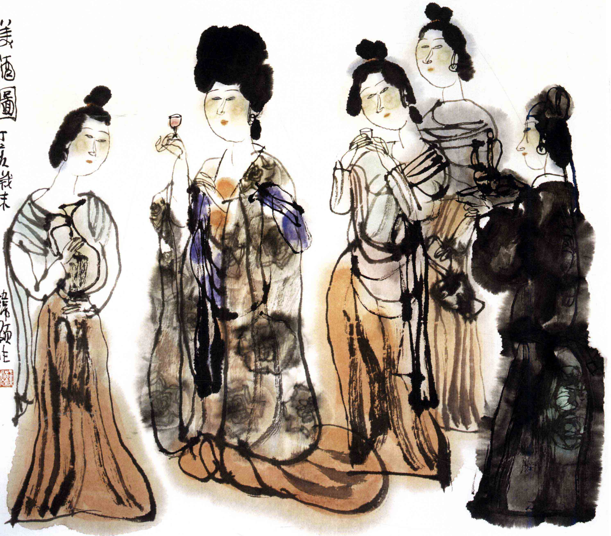
美酒 45cm × 48cm