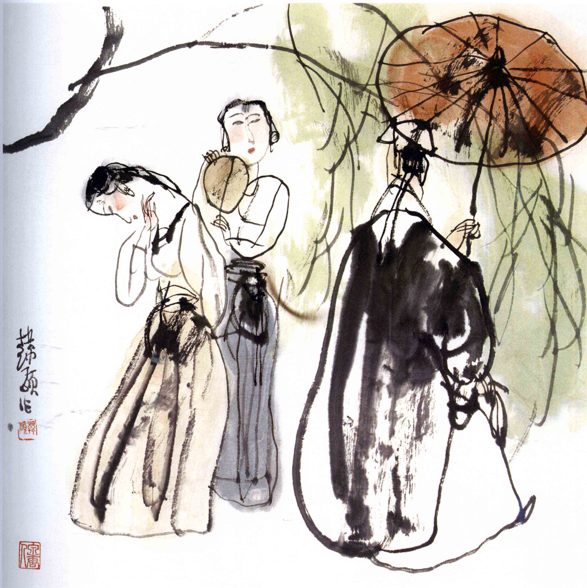
风雨同舟 33cm × 33cm