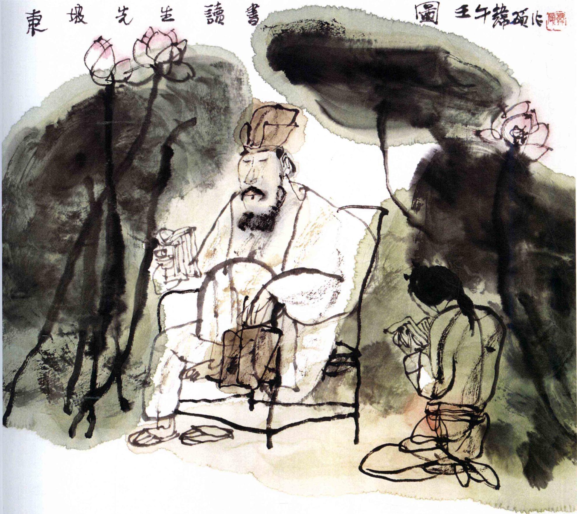
东坡读书图 33cm × 33cm