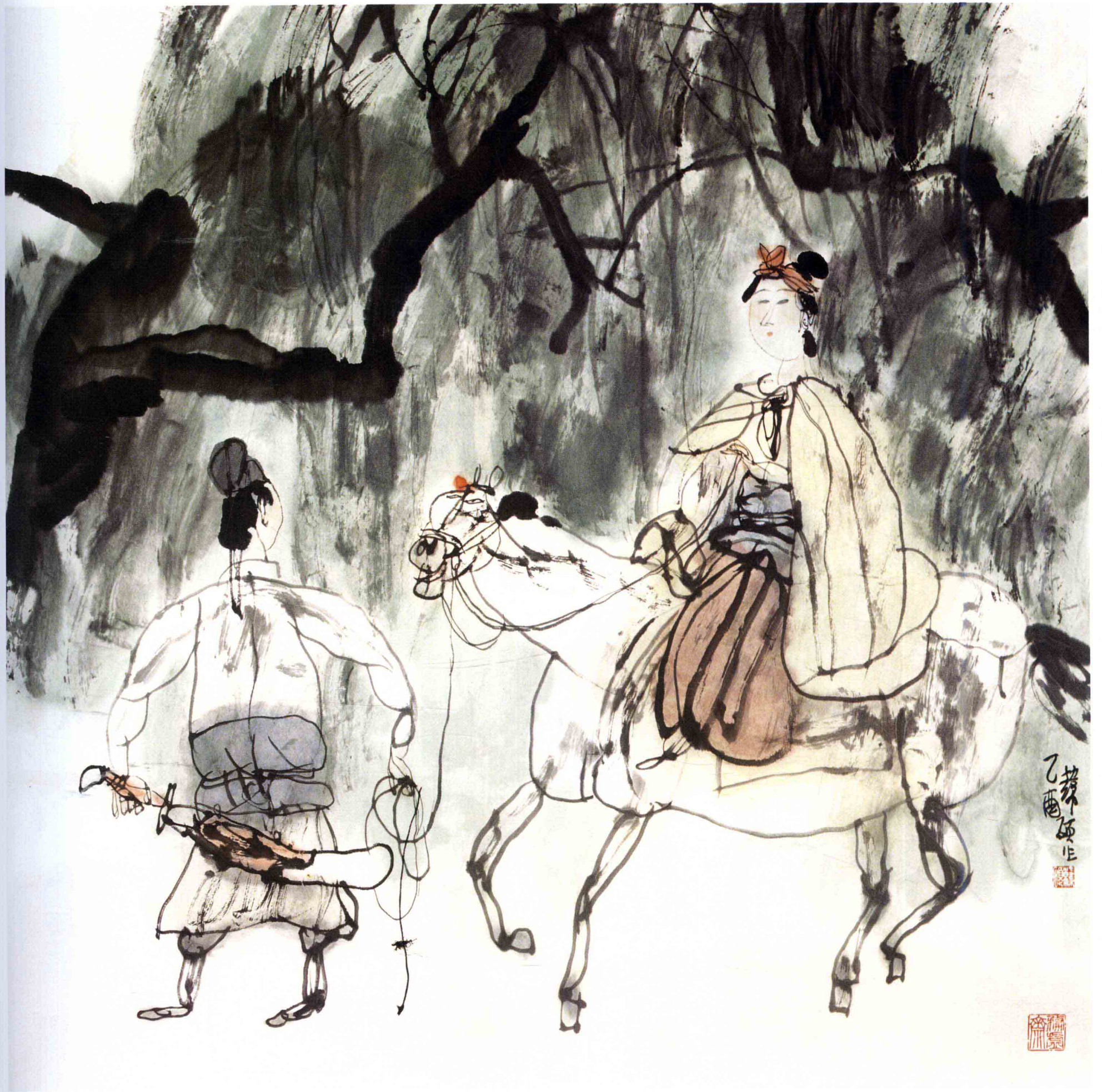
和风 68cm × 68cm