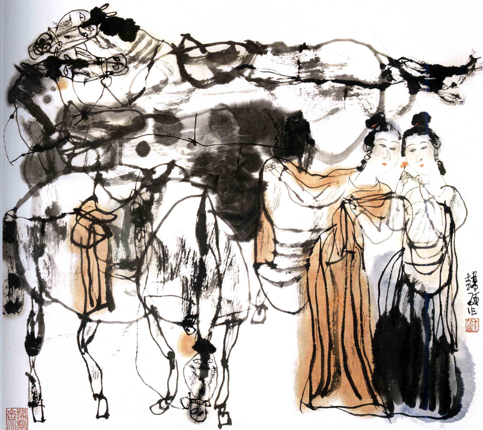
拈花 45cm × 48cm