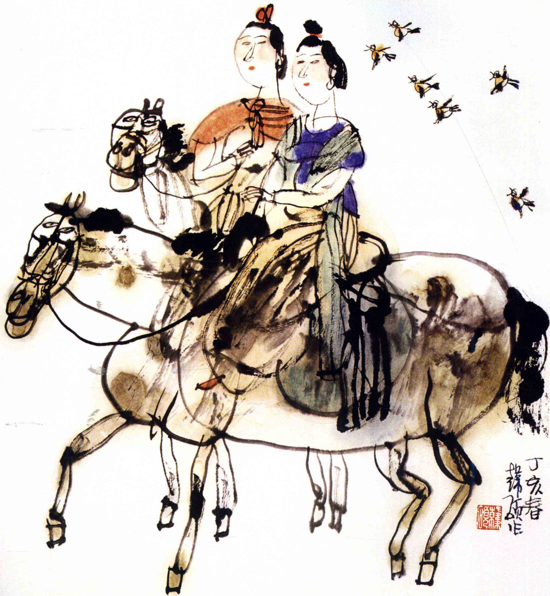
双骑 33cm × 33cm