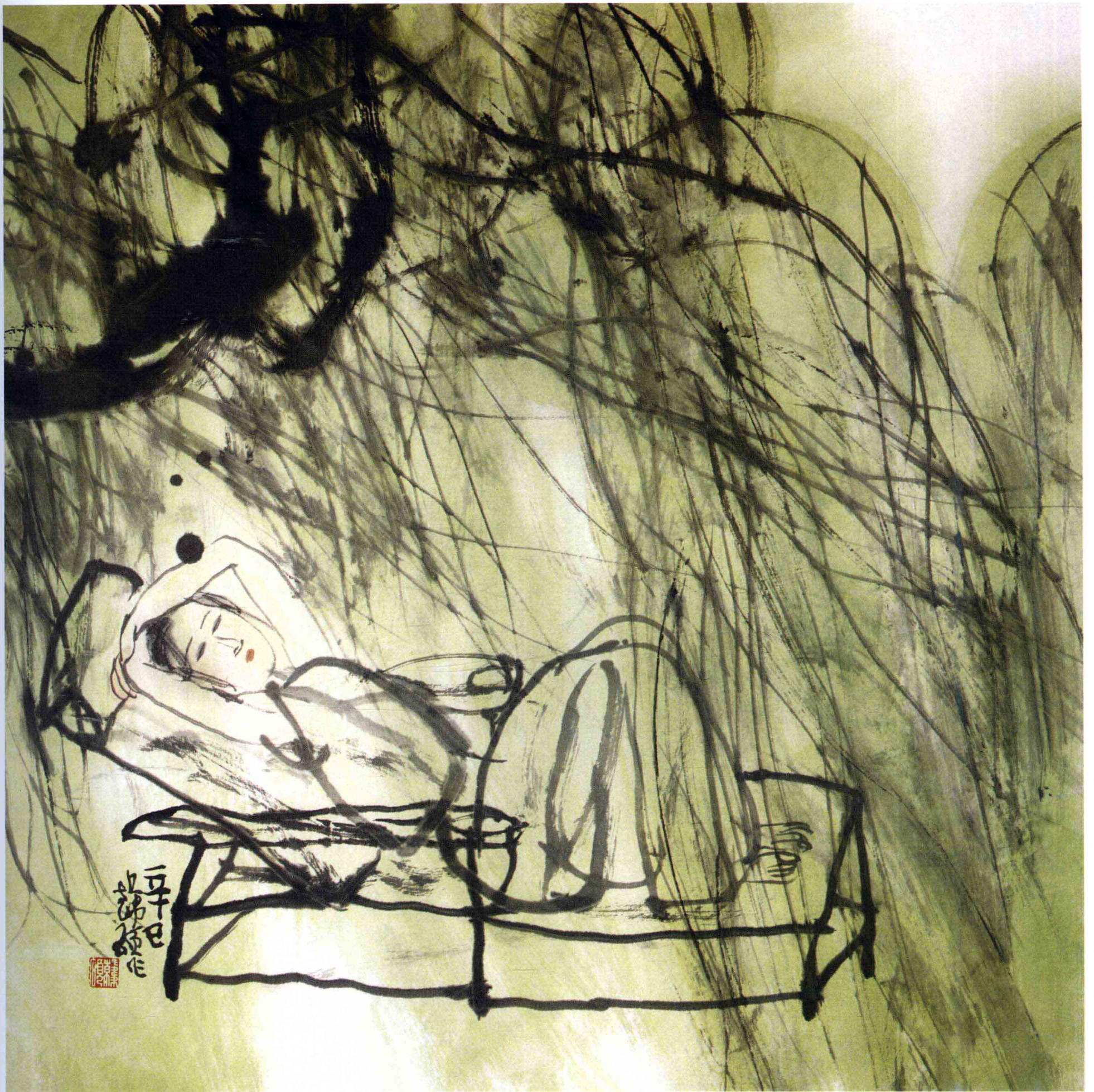
柳荫 50cm × 50cm