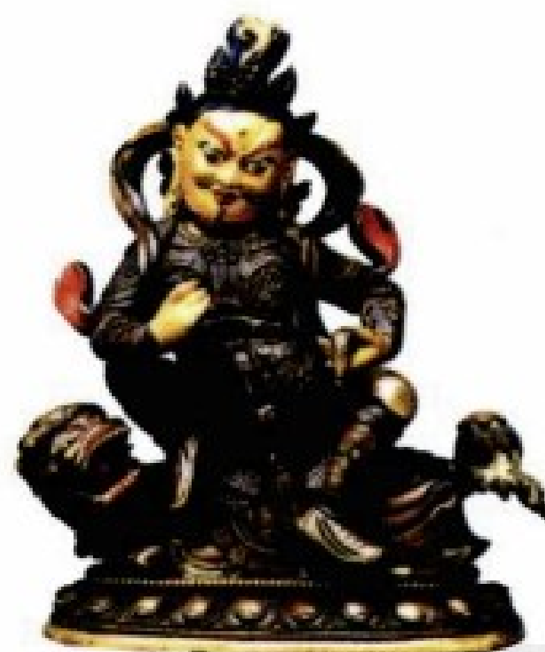
多闻天王 增财旺运、国库丰盈