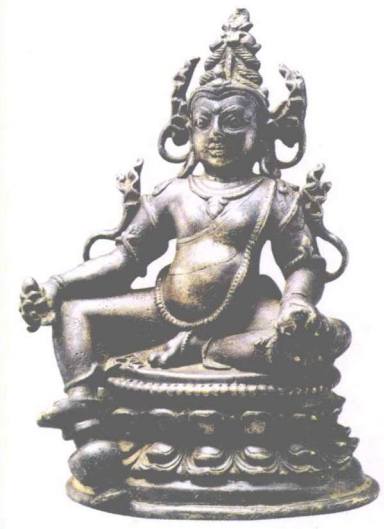
五姓财神之黄财神