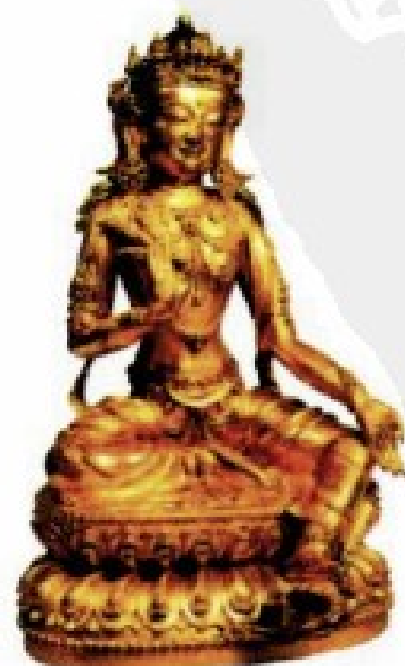
黄色财续母 获得世间无量财富、一切福德