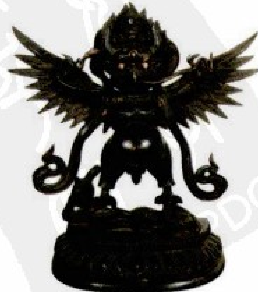
迦楼罗 得龙宫宝、天下甘露、财宝