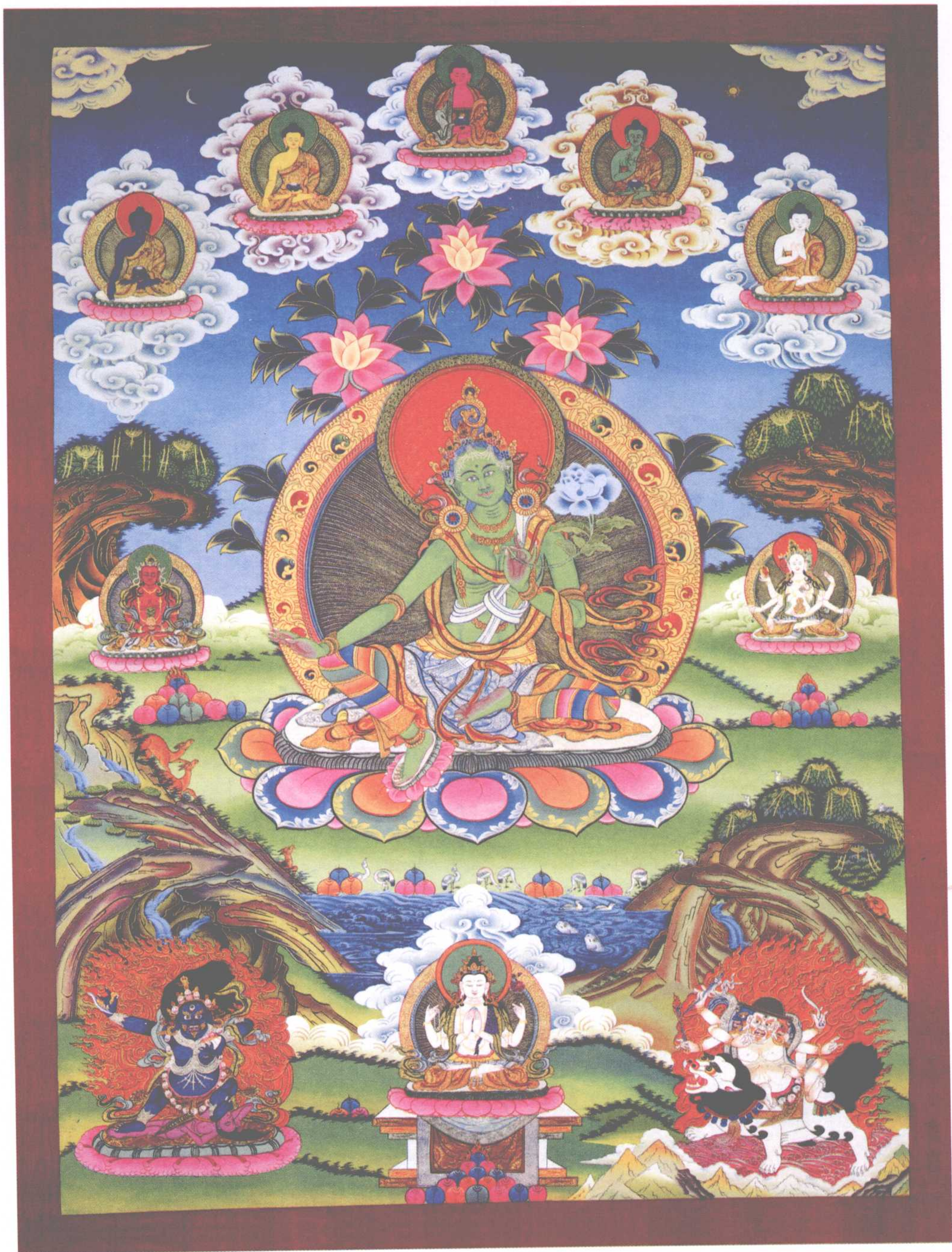
绿度母 布本设色唐卡 清代