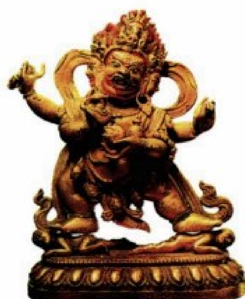
大黑天 护持众生使无损耗