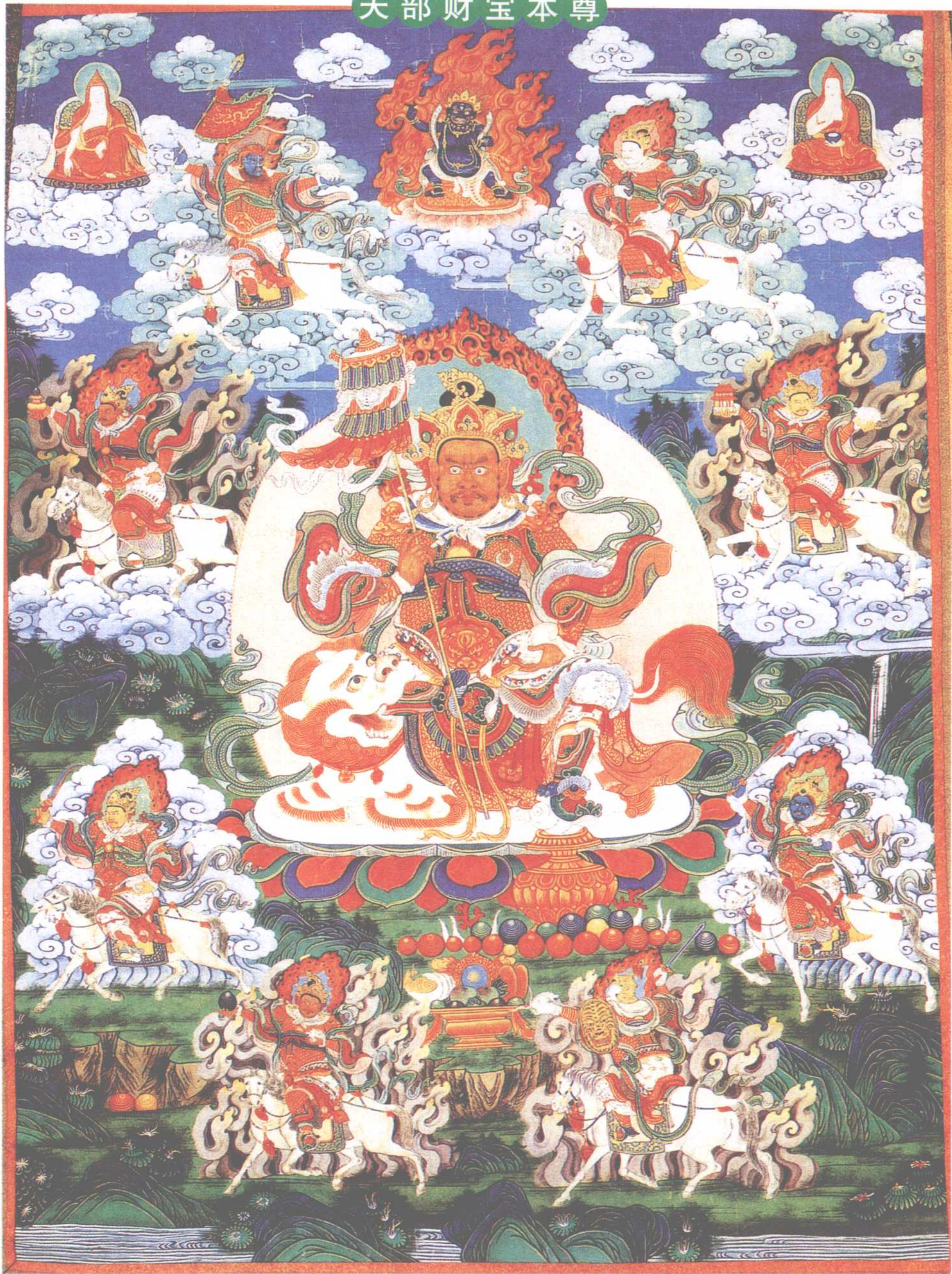
财宝天王 布本设色唐卡 18世纪