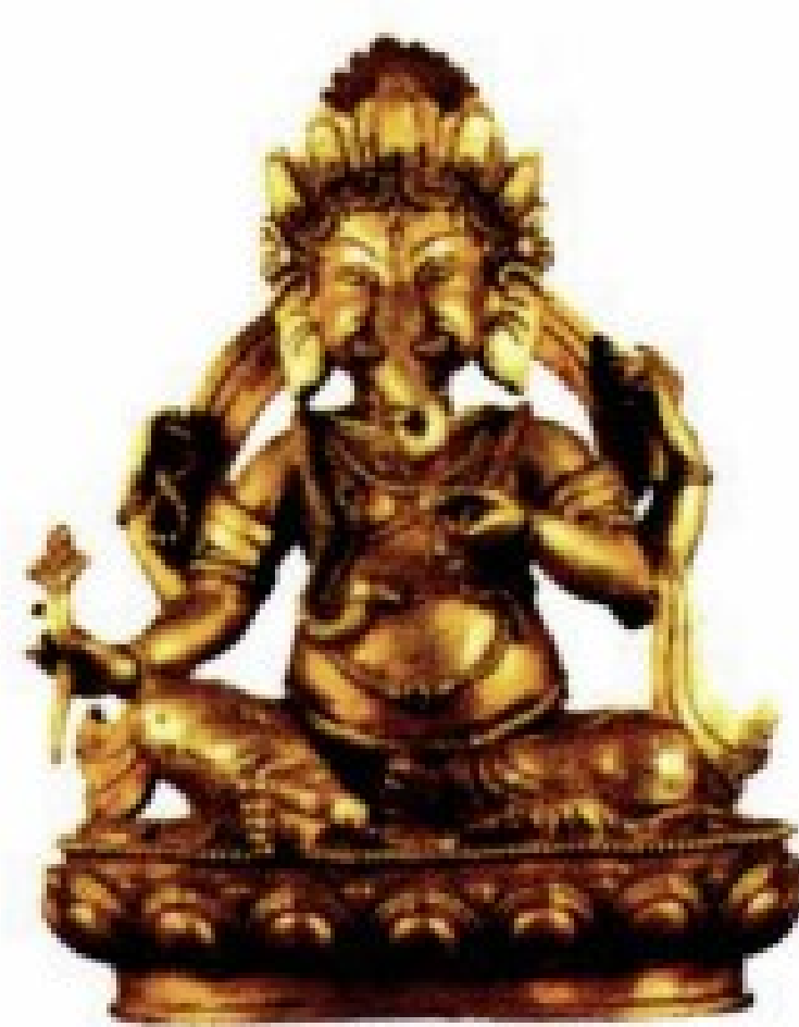
象头财神 增益寿命、得无尽财富