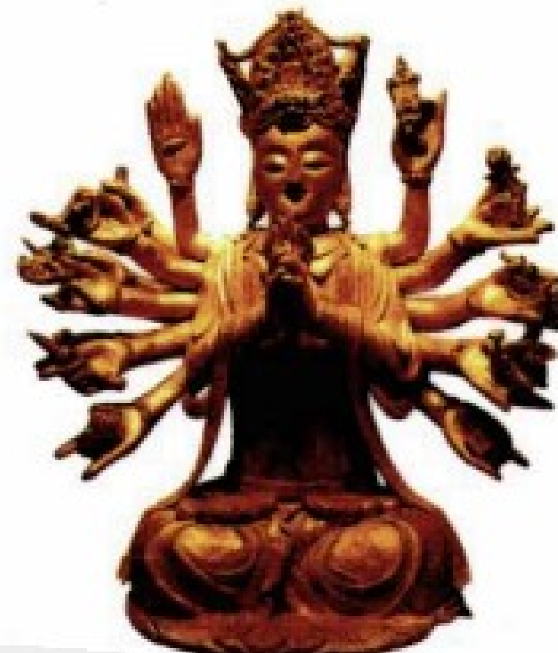
准提观音 远离一切灾障，增财、增禄、长寿