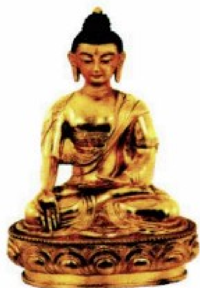
宝生佛 满足一切众生心所祈愿