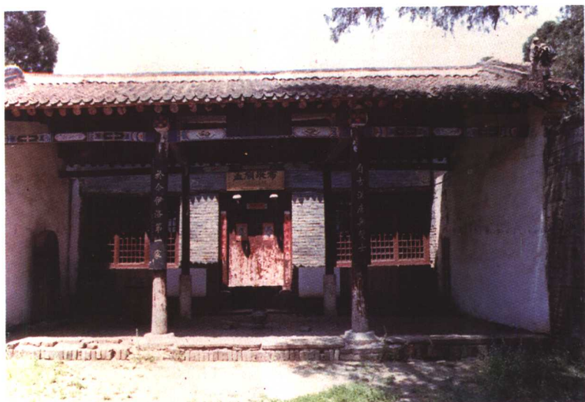
河南伊川二程祠庙