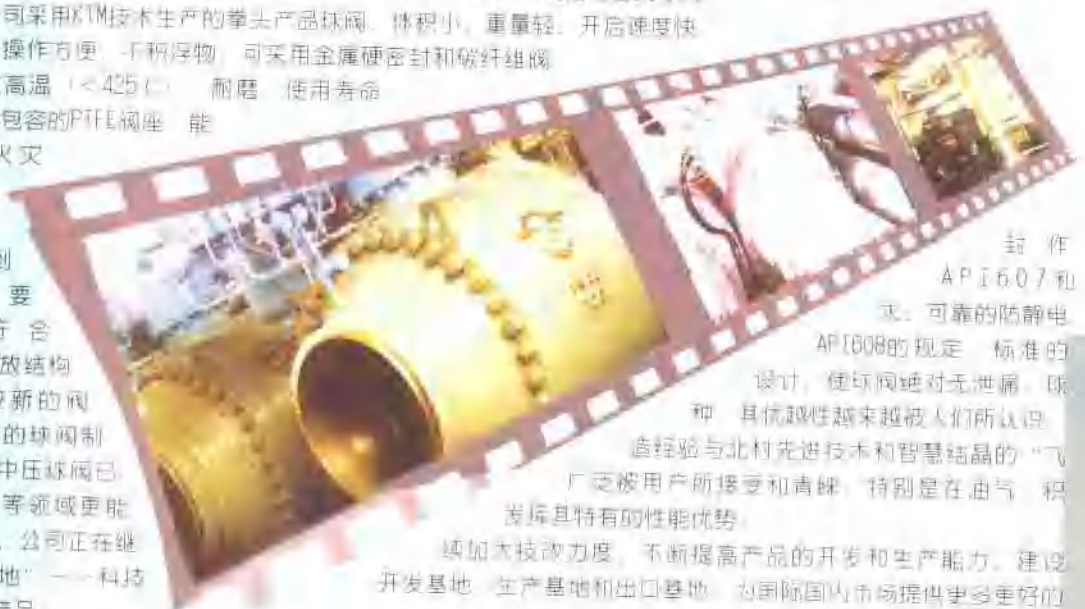
封作 API607和 可靠的防静电

API608的规定。标准的设计，使球阀绝对无泄漏。球种，其优越性越来越被人们所认识。