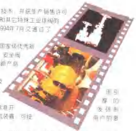
围引 厚的 发研制 用户的要