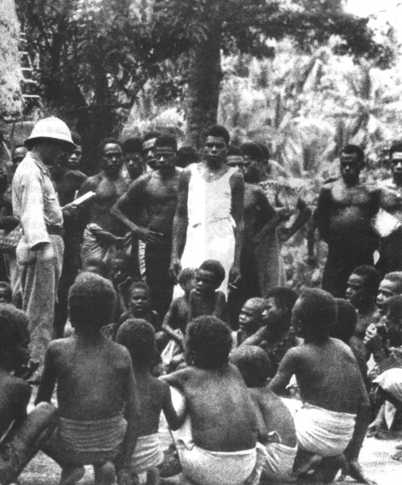
日本军队教新几内亚村民歌曲——在第一年占领中用来教化当地人的方法之一。