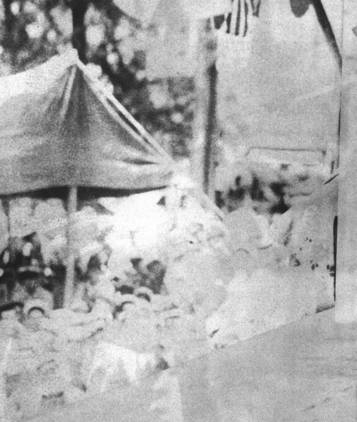
从本土来的为在腊包尔岛的日本军队“鼓劲”的歌舞伎——像美国劳军联合组织的滑稽剧。