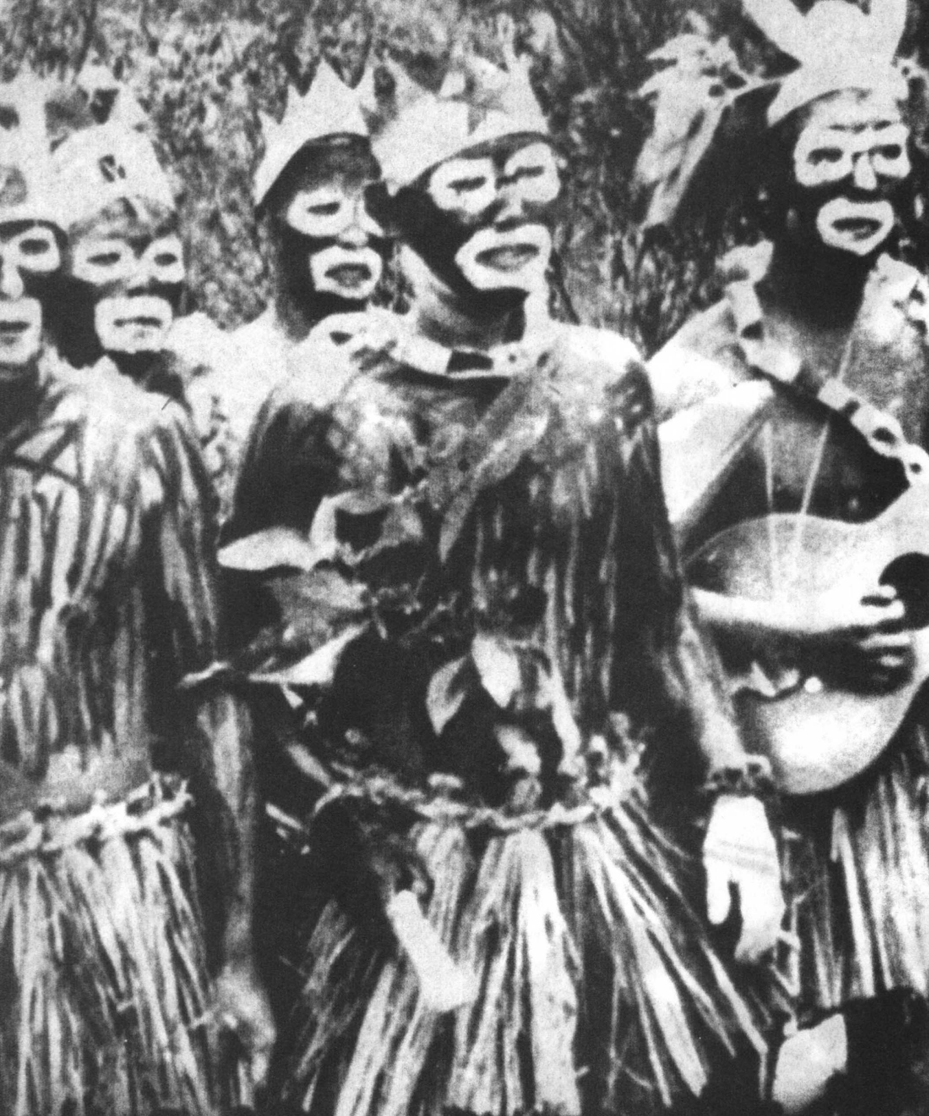
将身体涂上颜色,穿着草裙,戴着纸帽,日本兵准备好在一个节目中扮演岛上的土著人。