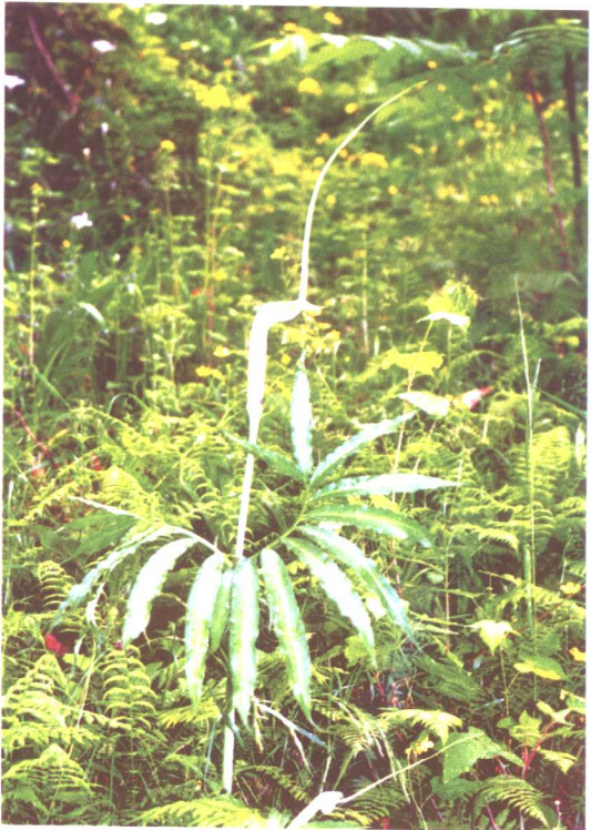
天南星 Arisaema heterophyllum Blume