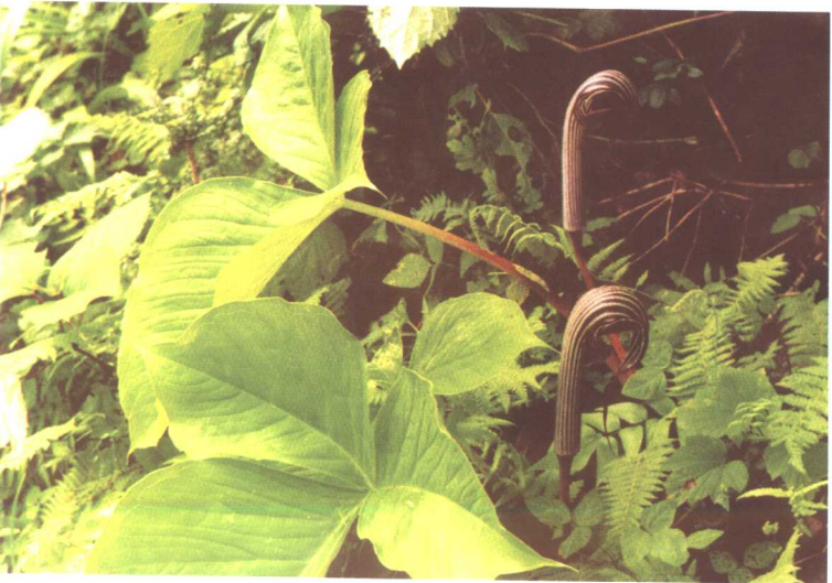
螃蟹七 Arisaema fargesii Buchet