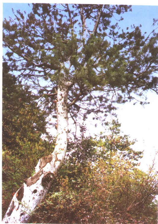
白皮松 Picea bungeana Zucc.ex Endl.