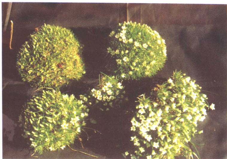
甘肃雪灵芝 Arenaria kansuensis Maxim.