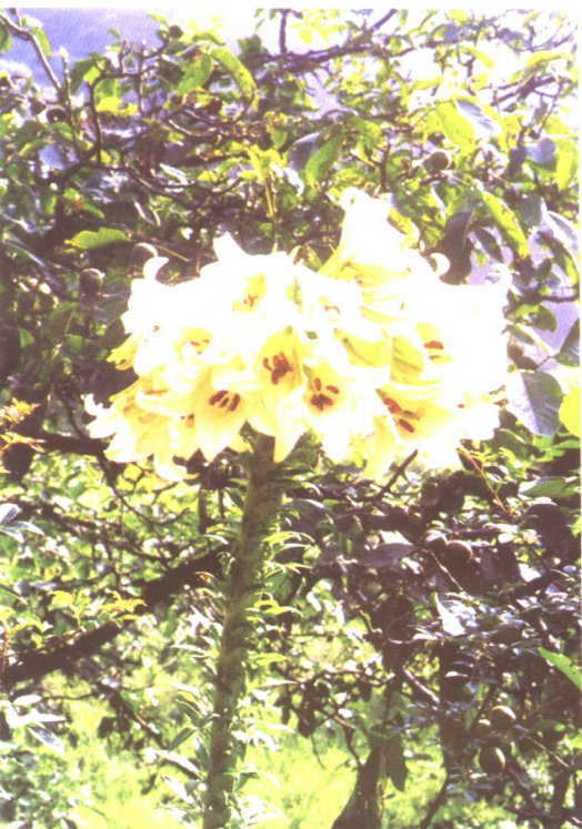
百合 Lilium brownii F.E.Brown ex Miellez var. viridulum Baker