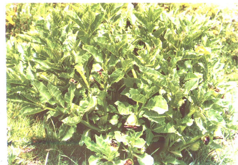
山萹苈 Anisodus tanguticus (Maxim.) Pascher