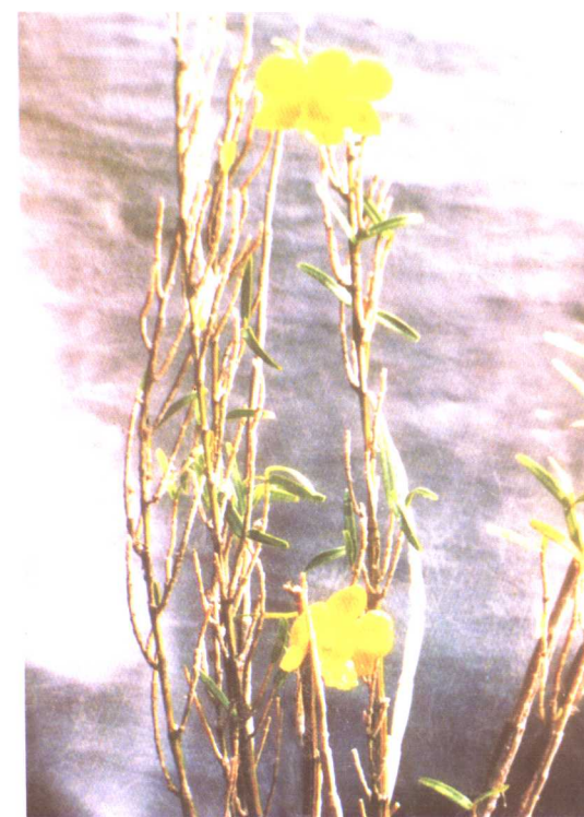
细叶石斛 Dendrobium hancockii Rolfe