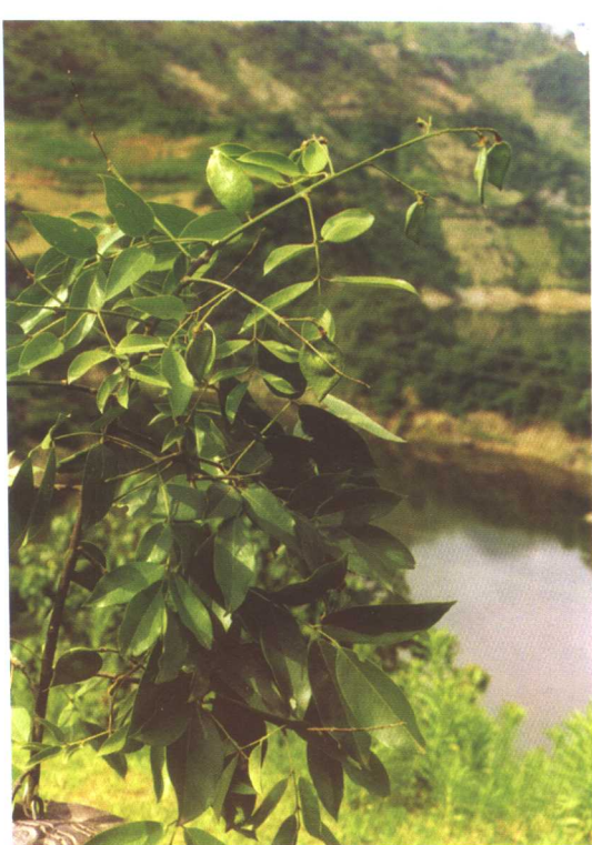
红豆树 Ormosia hosiei Hemsl. ex Wils.