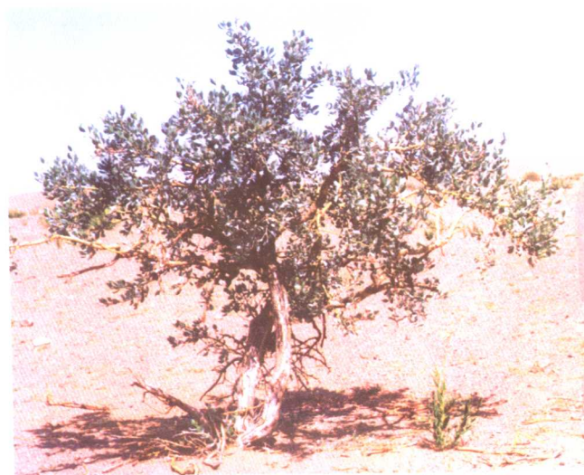
沙冬青 Ammopiptanthus mongolicus (Maxim. ex Kom.) Cheng. f.