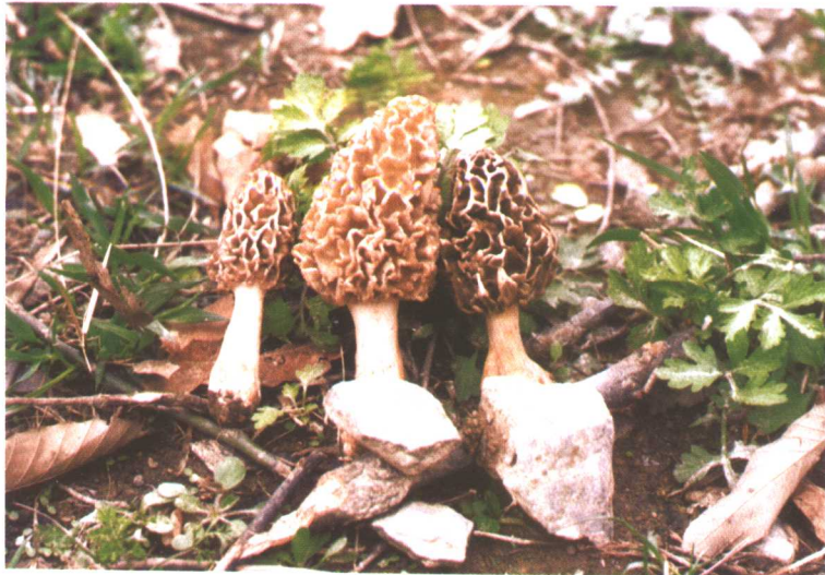
羊肚菌 Morchella esculenta (L.) Pers.