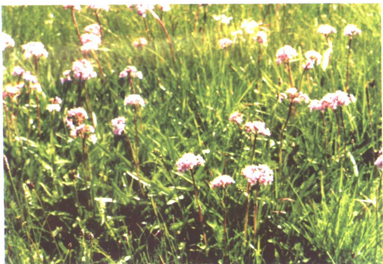
甘松 Nardostachys chinensis Batal.