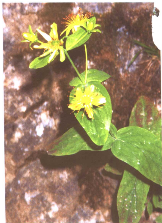
黄海棠 Hypericum ascyron L.