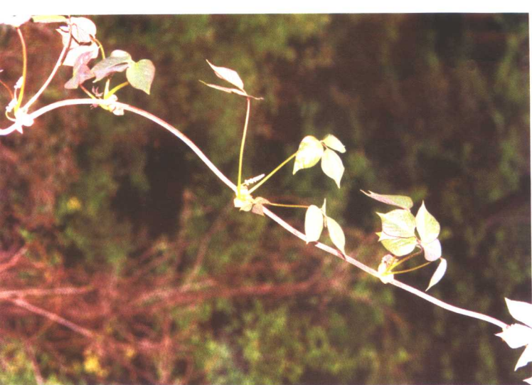
串果藤 Sinofranchetia chinensis (Franch.) Hemsl.