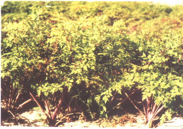
当归 Angelica sinensis (Oliv.) Diels