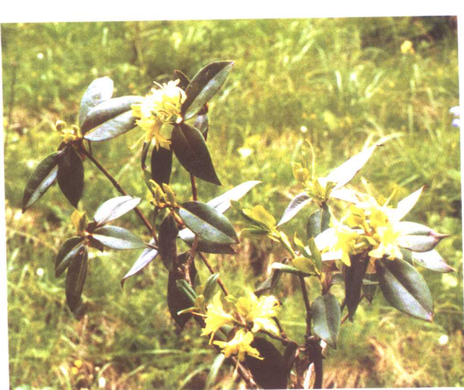
烈香杜鹃 Rhododendron anthopogonoides Maxim.