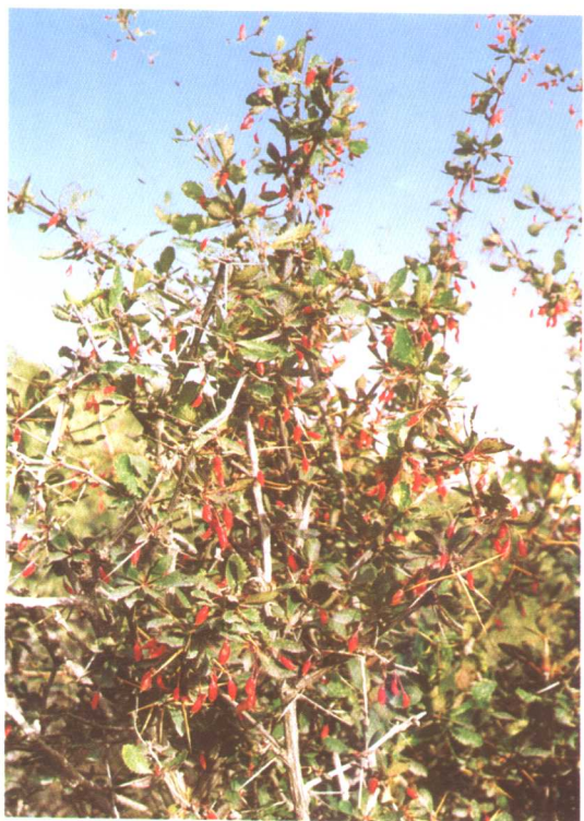
鲜黄小檗 Berberis diaphana Maxim.