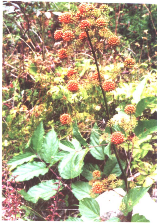
甘肃土当归 Aralia kansuensis Hoo