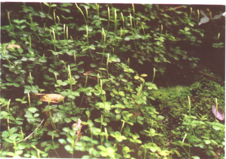
豆瓣绿 Peperomia tetraphylla (Forst.f.) Hook.et Arn.