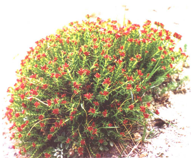
唐古特景天 Rhodiola algida (Ledeb.) Fisch. et Mey. var. tangutica (Maxim.) S.H. Fu