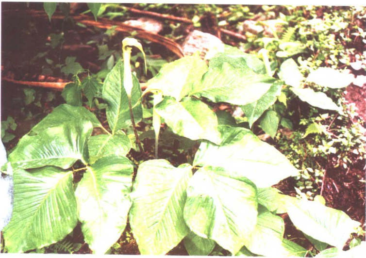
花南星 Arisaema lobatum Engl.