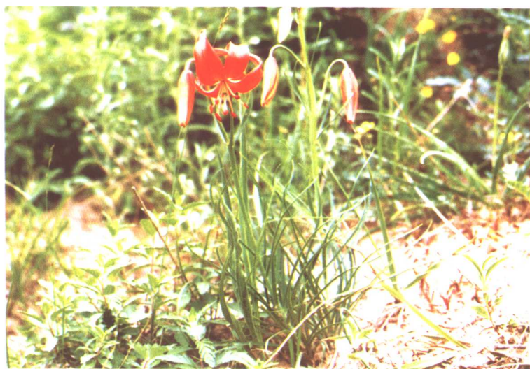
山丹 Lilium pumilum DC.