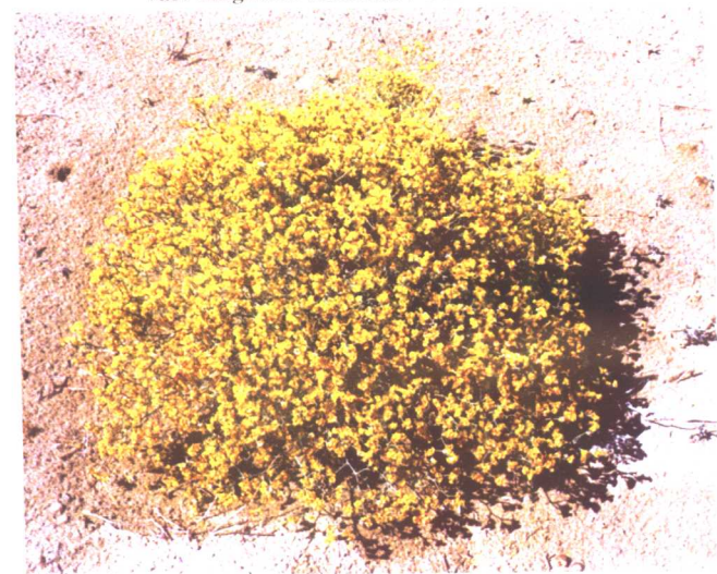
黄花补血草 Limonium aureum (L.) Hill