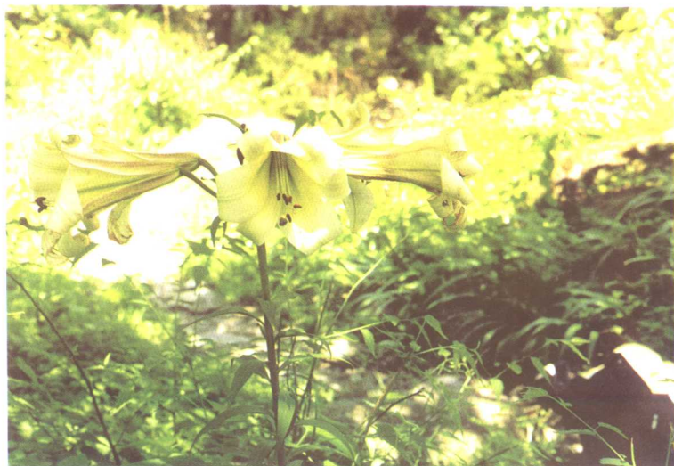
野百合 Lilium brownii F.E.Brown ex Miellez