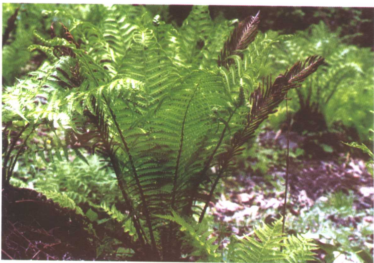
荚果蕨 Matteuccia struthiopteris (L.) Tadaro