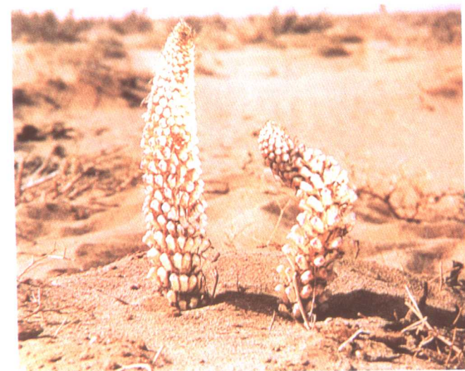
肉苁蓉 Cistanche deserticola Ma