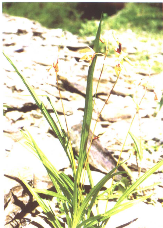
黄花白及 Bletilla ochracea Schltr.