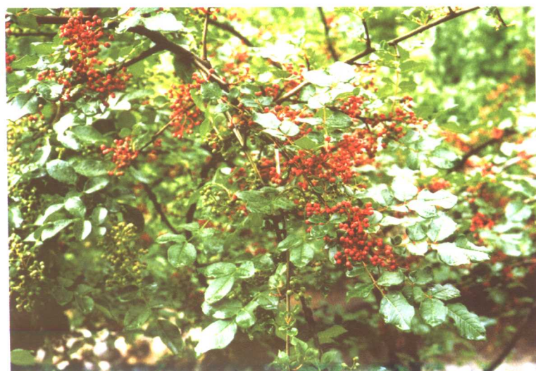
花椒 Zanthoxylum bungeanum Maxim.