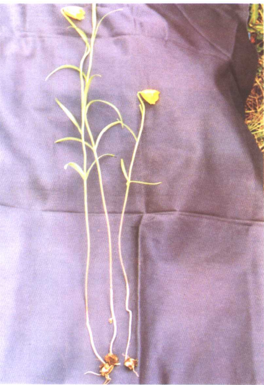
甘肃贝母 Fritillaria przewalskii Maxim.ex Batal.