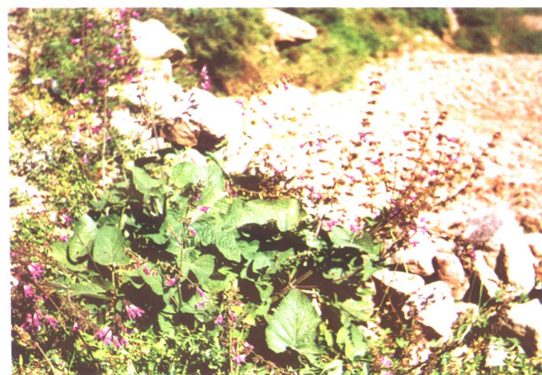
甘西鼠尾草 Salvia przewalskii Maxim.