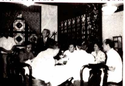
郭海军摄；右：广州校友欢迎代表团 王积康摄