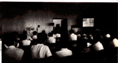
▲放录像介绍新竹清华大学