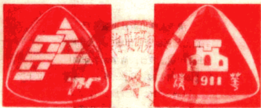
八十周年校庆纪念章