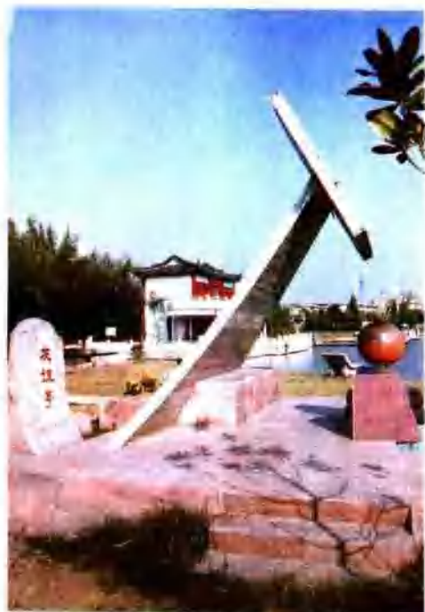
▼ 友谊亭背后的碑文

1945年6月8日凌晨，一架美国超级堡垒B-24型解放式轰炸机在长江口执行抗日任务，飞临海门宋季港附近上空时，气缸爆炸，当即坠毁，11名机组人员中8名遇难。1984年8月下旬，幸存者达·维·雷特蒙偕夫人肖美来海，并为兴建“友谊亭”献资5000美元。图为1988年9月海门县人民政府在海门东洲公园建造的“友谊亭”景。