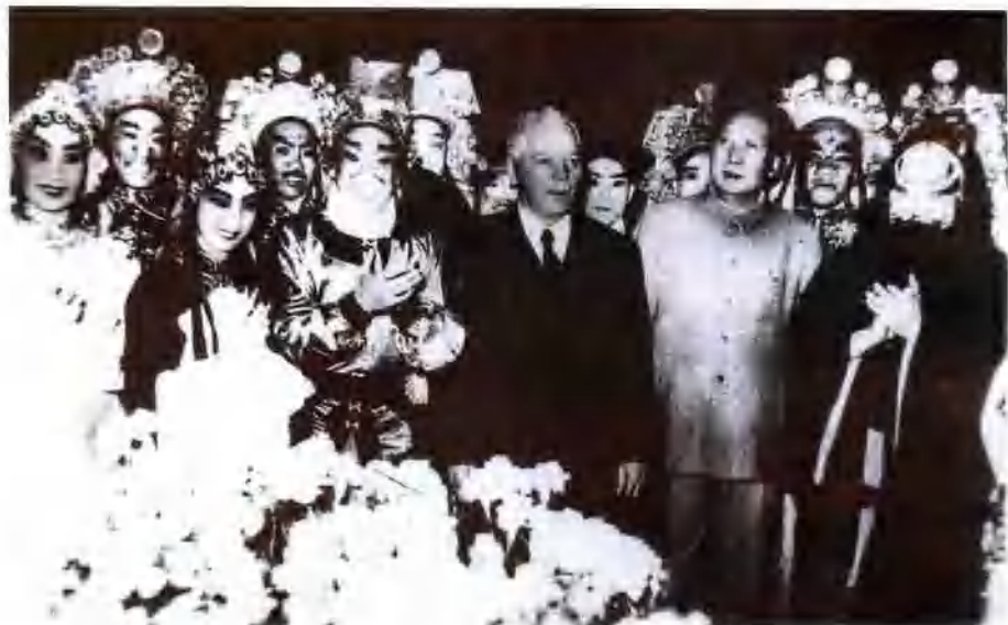
1957年5月2日厉慧良在北京为 毛泽东主席、前苏联伏罗希洛夫主席演出 《野猪林》后合影。（厉慧良位于伏罗希洛夫右侧）