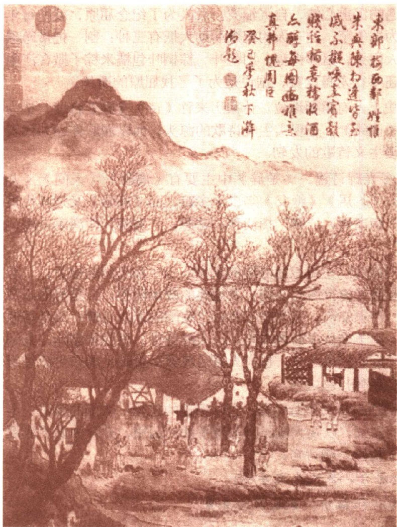
毛诗图 明 周臣绘

《诗经》作为中国诗歌的源头，它不仅形式多样、内容丰富，而且还唱出了民间百姓的心声，唱出了对生活最真实的体验。《诗经》中赋、比、兴表现手法的运用，形成了中国诗歌审美中的一个传统，从汉乐府到“盛唐之音”再到近现代，从屈原到李白、杜甫再到今天的诗人，都在自觉不自觉地运用这一诗歌表现技法，从而提高了诗歌的审美情趣和文化韵味。