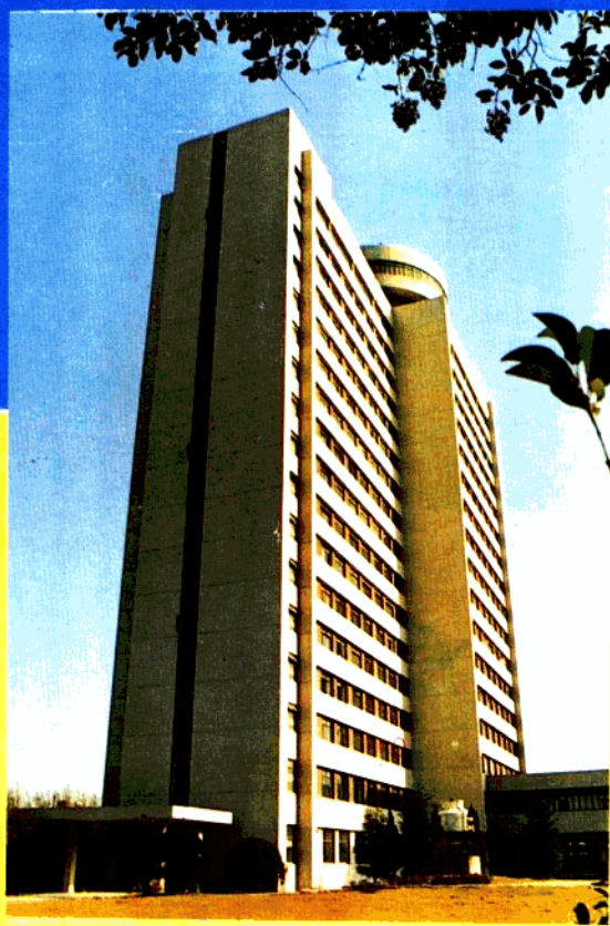
全国首屈一指的华东师范大学文科楼，1988年被评为上海市优质工程。