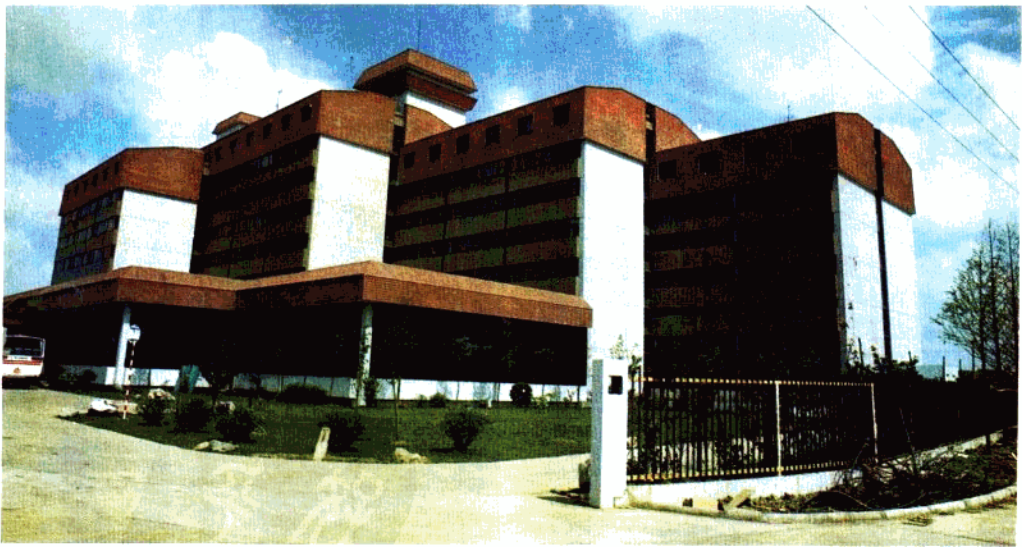
三星宾馆——天马大酒家。

地址：上海市 湖南路300号 电话：377040（总机） 电报挂号：7111（上海）