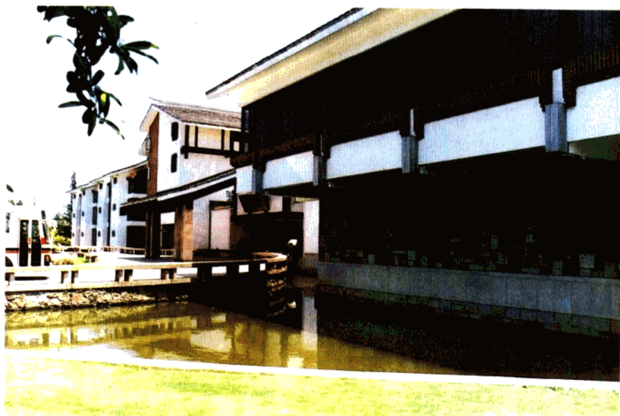
市优质工程——英女皇曾下榻的西郊宾馆“睦如居”楼。