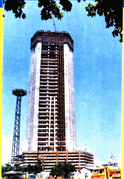
上海物资贸易中心大楼。