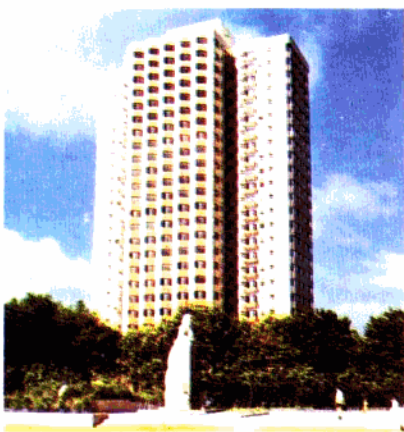
▲ 雁荡大厦 (28层, 83.5米高)。