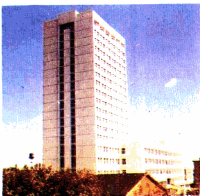
▲ 上海交通大学包兆龙图书馆 (20层、72.8米高)。

本公司视质量为生命，积极推进技术进步和全面质量管理。先后获14项部优、市优工程和多项国家级、市级重大科研成果奖，被授予市级质量管理奖、企业管理优秀奖、安全生产先进单位等称号。1988年，评为国家二级企业、国家质量管理奖企业。雁荡大厦工程获全国建筑工程最高荣誉鲁班奖。公司热忱欢迎在工程承包，委托加工、技术开发、合资联营、人才培养等多方面进行广泛合作与交流。