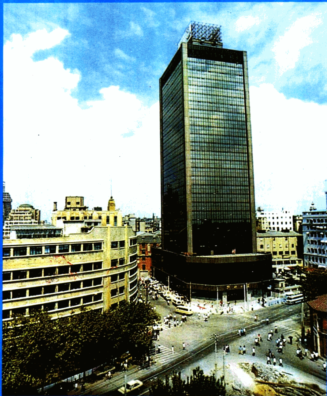
上海联谊大厦 建筑面积29771平方米 幢30层 建造工期 412天,质量评为市优质工程奖、建设部优质 工程奖。