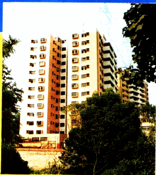
座落于虹桥俱乐部，专供外籍在沪工作人员居家的龙柏高级公寓。