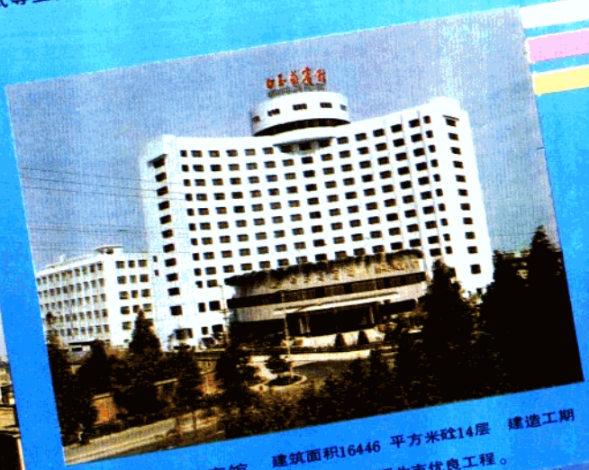
上海白玉兰宾馆 建筑面积16446平方米 14层 建造工期 872天，质量评为市优良工程。