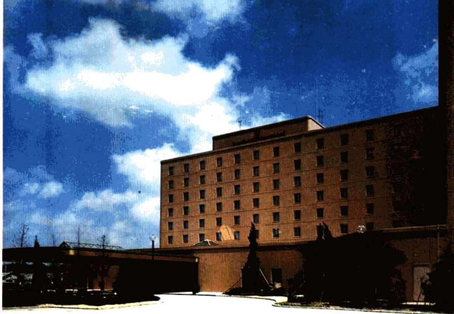
市优质工程——虹桥国际机场宾馆。