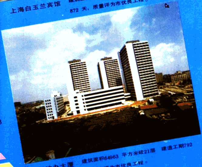
上海沪办大厦 建筑面积64963平方米 21层 建造工期792 天，质量评为市优良工程。