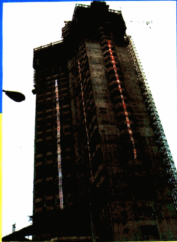
建造中的外省市驻沪机构36层超高层—— 联合大厦雄姿。