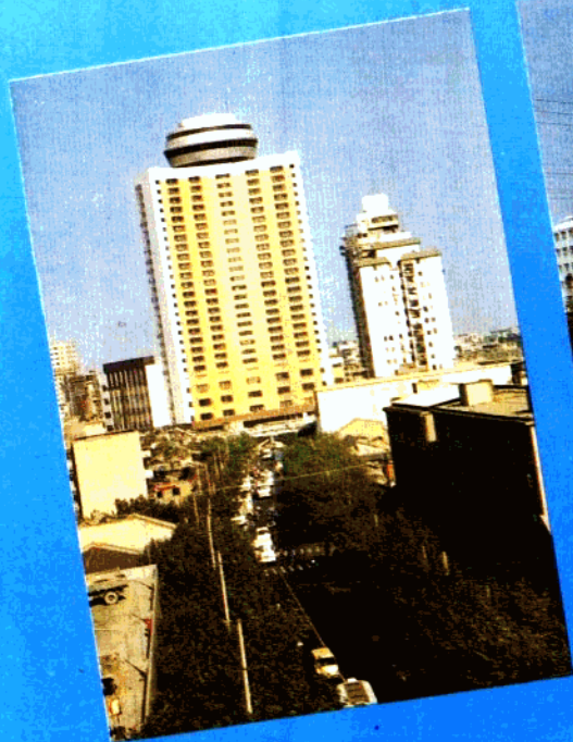
上海远洋宾馆 建筑面积51418平方米 28层 建造工期 1191天 质量评为市优良工程。

公司拥有雄厚的技术力量和先进的机械设备。经营范围有土建施工，民用工程，水电安装及工业设备安装（包括水、电、通风、电梯、锅炉、行车），建筑装潢，有关建筑机械设备制造、维修、租赁和建筑材料仓储、供应、测试等业务。