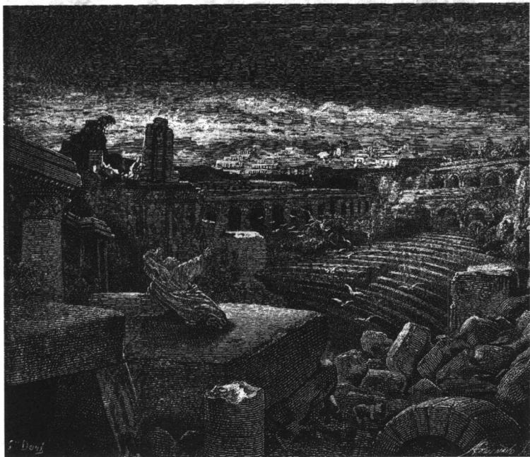
以赛亚论巴比伦的覆灭

势空前强盛,经济繁荣,大兴土木,筑起了圣殿、宫宇,美奂美轮,成立了庞大的乐队,产生了大量的抒情诗、哲理诗、辉煌的史记。自从王国分裂(公元前 933 年)以后,南朝犹大和北朝以色列,愚蠢地自相残害,国势日衰,在四周强邻虎视眈眈之下,大有亡国的危险;于是先知——社会改革家应运而生,他们敢