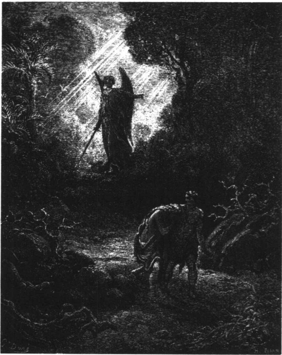
弥尔顿的史诗《失乐园》取材于人类始祖亚当、夏娃被逐出伊甸园的故事

中世纪晚期的“文艺复兴”运动和“宗教改革”运动是一件事物的两面,都是反对天主教 ② 教皇势力跋扈的。恩格斯把宗教改革的领袖马丁·路德称为“文艺复兴巨人”之一。在这个运动中,古典文化得以复兴,希伯来和基督教初期的精神也基本得以恢复,圣经全部被译成人民的语言,普及到人民中去。在这个运动之后,古典文化传统和中世纪文化传统,成了哺育欧洲近、现代文化的两个乳房。在西方近、现代的文学中交织着希腊神话和圣经的典故,不知道这些典故,简直看不懂作品。17世纪的大诗人弥尔顿