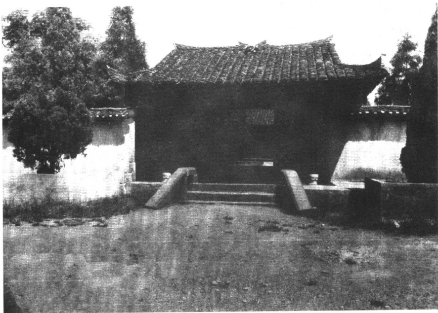
桑植县洪家 关贺龙故居